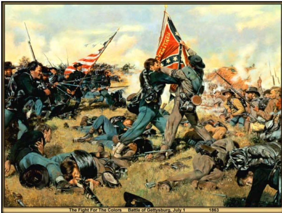
The Fight For The Colors Battle of Gettysburg, July 1 1863

Якщо порівняти воєнне протистояння у США під час Громадянської війни, яке характеризувалось динамічним розвитком подій, і тривало понад чотири роки, то протистояння на сході