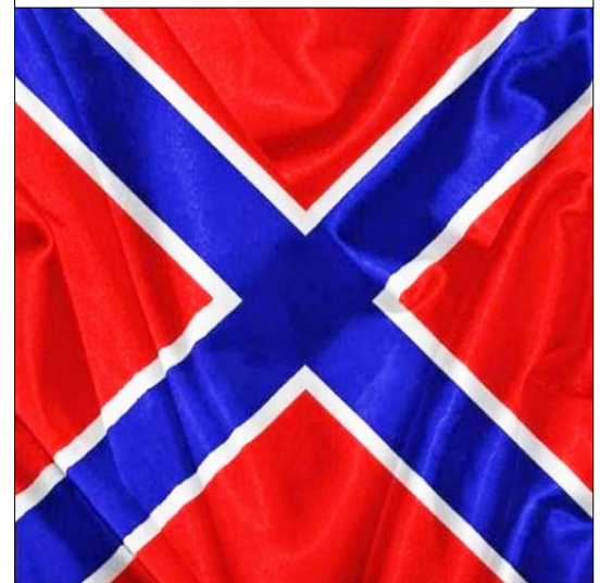
Прапор терористів так званої Новоросії

Північ не була готовою до війни. Більшість офіцерів регулярної армії перейшла на бік Конфедерації, тому довелося терміново формувати армію. Противники війни були і в державному апараті, вони всіляко перешкождали організаційним заходам адміністрації Лінкольна.