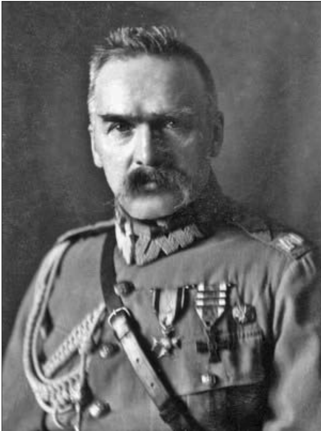
Маршал Юзеф Пілсудський, керівник Польщі

Щодо майбутньої Польської держави Вілсон зазначав: «Має бути створено незалежну Польську державу, яка повинна включати в себе території з незаперечно польським населенням...»