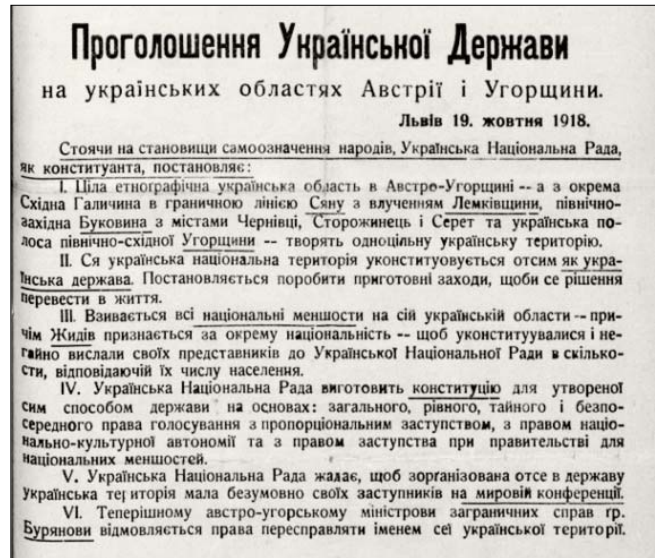
Прокламація про створення Української Держави 19 жовтня 1918 року

19 жовтня Українська Національна Рада проголошує українську державність, яку ми сьогодні згадуємо як Західно-Українську народну республіку.