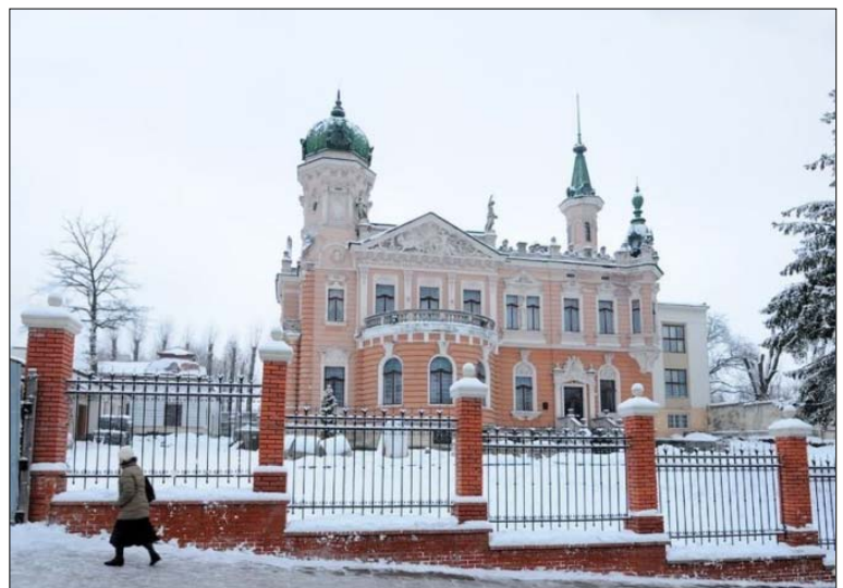
Національний музей у Львові, вул. Драгоманова