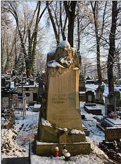
Надгробок на могилі Іларіона Свенціцького, Личаківський цвинтар

рим і доброзичливим, і ця невимушеність передавалась тим, хто потрапляв у його ауру. Повага і пошана до людей лежали в основі його природної поведінки.