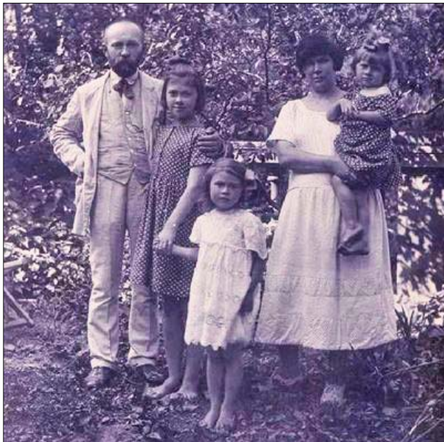
У родинному колі (1924 р.)

верситеті, навчається в Археологічному інституті. Повернувшись до Львова, відбуває однорічну службу в австрійському війську і починає працювати в Народному домі. Одночасно продовжує навчання у Віденському університеті і під керівництвом відомого професора-славіста Ватрослава Ягіча захищає докторську дисертацію.