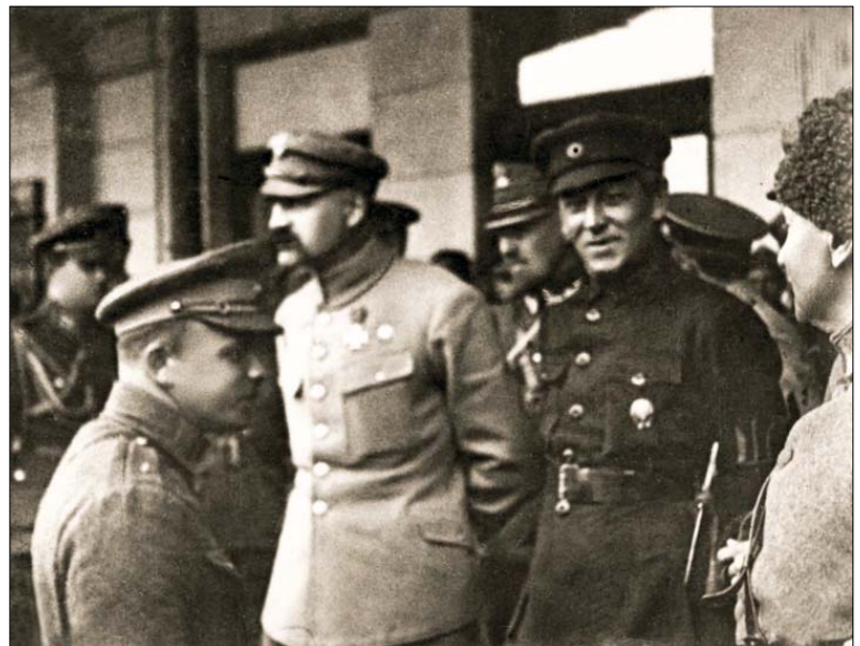
Ю. Пілсудський та С. Петлюра. Київ, 1920

Починалися польсько-російські перемовини в Мінську, ще влітку, після того, як польсько-українське військо залишило Київ. 30 липня, сподіваючись розгромити Польщу, більшовики створили у Білостоці т. зв. «Польський революційний комітет». Очолив його Ю. Мархлевський, а входили Ф. Дзержинський (творець «ЧеКа»), Ф. Кан, Ю. Уншліхт та інші. Ще раніше, 8 липня, в Києві створили Галицький революційний комітет. Його головою більшовики призначили В. Затонського. Неукраїнська «Істо-