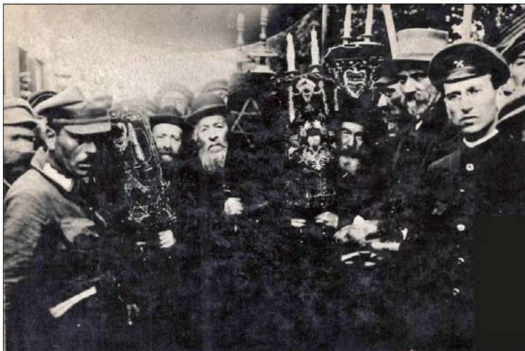
Єврейські делегація вітає Симона Петлюру. 1919 рік

Іван Мазепа пояснив, чому С. Петлюра став найпопулярнішим провідником української революції: «На мою думку, головний секрет цього полягає в тому, що Петлюра був надзвичайно енергійний, відданий ідеї ентузіаст з великою вірою в українську справу. В початковій стадії революційних рухів особистий вплив грає значну роль. В умовах української революції Петлюра виявив цінні риси характеру: він умів захоплювати своїм запалом других, умів вести за собою маси, кликати їх до такої ж боротьби й жертв».