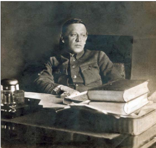
Симон Петлюра в Парижі. 1925 рік

Симон Петлюра вважав, що в мирний час для війська потрібно створити такі умови, «...що давали б максимум гарантій за успішне виконання ним своєї ролі під час війни. Ціна крові й жертв, що ними купується мир та добробут нації, завжди буде меншою, коли раніше думають про відповідальну роллю війська». Інакше кажучи, якщо не хочеш годувати свою армію, то годуватимеш армію окупанта.