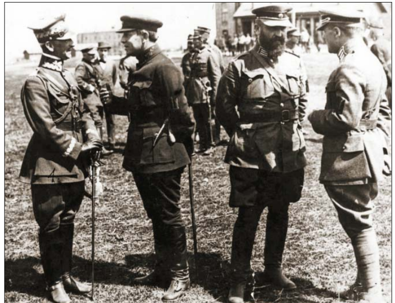
Генерал Антоній Лістовський, Симон Петлюра, полковник Володимир Сальський, полковник Марко Безручко, офіцери, Бердичів, квітень 1920 р.

С. Петлюра як військовий діяч того часу вирізняється кількома характерними рисами: розумінням значення регулярної дисциплінованої і національно свідомої армії для розбудови держави; моральною відвагою очолити боротьбу у найкритичніший момент; вірою в перемогу і боротьбою