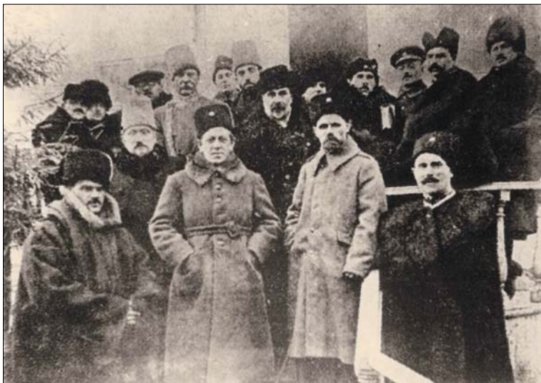
Політичне і військове керівництво УНР. У центрі Симон Петлюра і генерал Михайло Омелянович-Павленко, листопад 1920 року

Справді, роль С. Петлюри не можна недооцінювати, коли мова заходить про організацію збройного захисту України. Цього не могли зробити ні В. Винниченко, ні М. Грушевський. Більше того, обидва опинилися на еміграції ще перед закінченням національно-визвольних змагань.