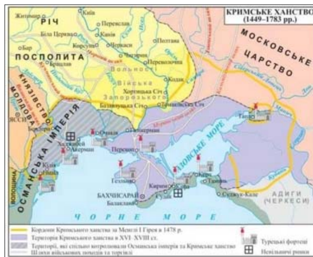
Кримське ханство у XVIII ст.

Хоча загальні геополітичні обставини надалі не сприяли тому, аби народи й держави басейну Чорного моря могли об'єднатися (руїнницькі напади степових кочівників – сарматів, аланів, гуннів, булгарів, мадярів, хозарів, печенігів, половців), у цьому макрорегіоні постійно тривали процеси до консолідації. Наступним історичним прикладом великого геополітичного об'єднання в просторі Чорного моря став факт існування Кримського ханства протягом XV–XVIII ст., яке охоплювало своєю владою територію від Буджака до Кубані.