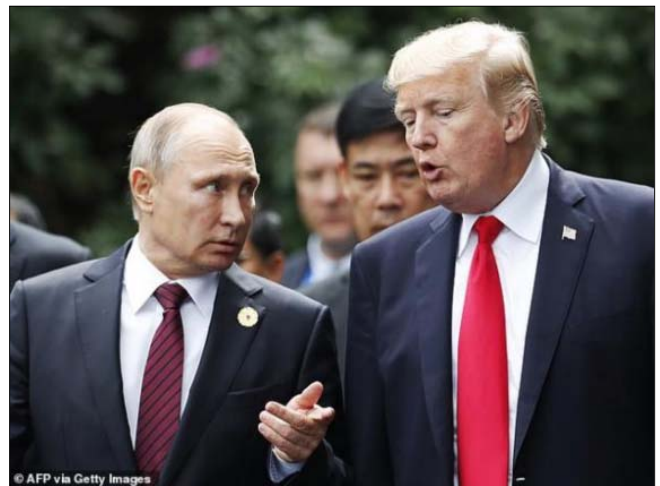
Трамп і Путін у 2017 році

Трамп зацікавив КДБ, тому що був «марнославним, самозакоханим, дуже сприйнятливим до лестощів і жадібним», пише автор.