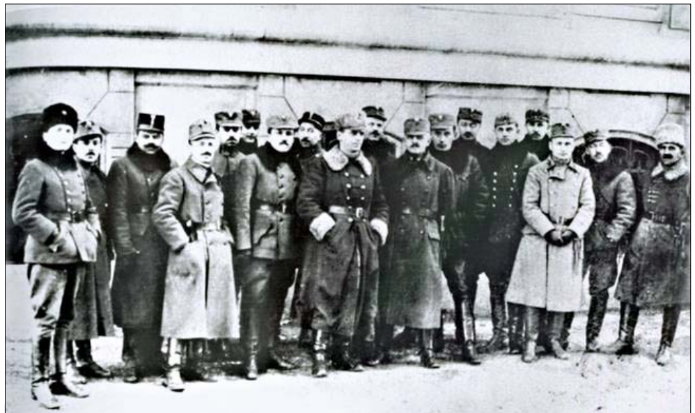
Місія Антанти у Львові. 1919 рік