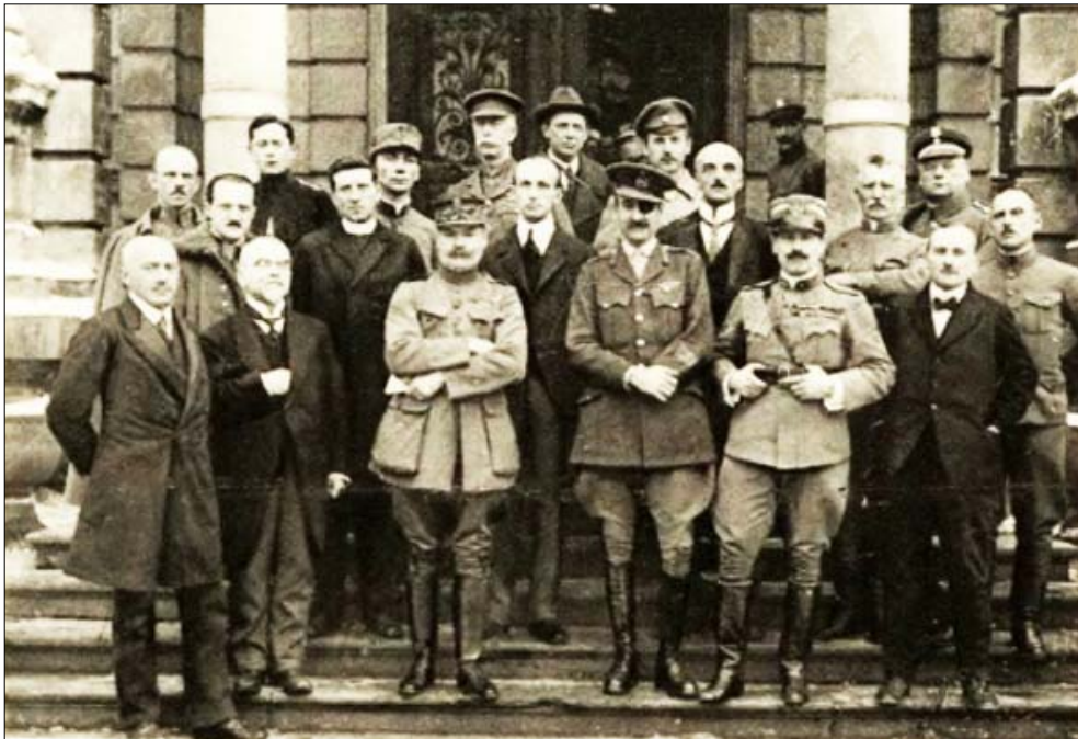
Місія Бертелемі місія у Львові. Зустріч з українською делегацією. 28 лютого 1919 року

«Польська теза про те, що нація, яка у світовій війні 1914–1918 вийшла на стороні переможців, має право на кордони 1772 року, заставляє сучасного англієця протерти очі й розреготався, бо якщо взяти й розглянути іс-