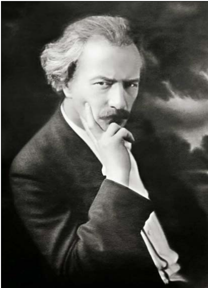
Падеревські Ігнаці Ян

торії Польської Держави, представленому президентові Вільсону у Вашингтоні ще 8 жовтня 1918 року, Дмовський визнав, що поляки Східної Галичини становили лише 25 відсотків від загальної кількості населення [11] (слід зазначити, що навіть ця цифра була перебільшена). Тому польські представники відкрито висловили своє невдоволення Тринадцятим Пунктом Вільсона. Дмовські у своїй книзі «Польська політика» виступав проти застосування принципу «з виключно польським населенням» до вирішення питання про кордони Польщі, оскільки «польський національний