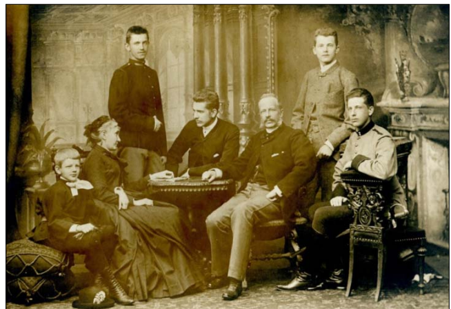
Родина Шептицьких, батьки і сини

Наприкінці лютого Роман одужує, однак лікарі наполягають на звільненні з військової служби. (Перенесена у війську скарлатина дала ускладнення на суглоби, а потім призвела до паралічу. З 1934 року Митрополит Андрей був в інвалідному візку. Як виняток, йому було дозволено проводити Богослужіння сидячи). 22 червня 1884 року – звільнений із військової служби.