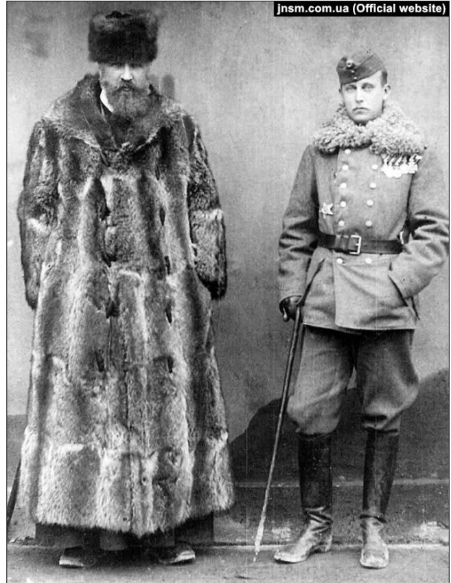
Митрополит Андрей Шептицький (ліворуч) і Вільгельм Габсбург (Василь Вишиваний). 1918 рік

тивну участь і в будівництві українського війська, відіграло ключову роль в їх духовному та моральному вишколі. Маючи досвід капеланської діяльності в Легіоні Українських січових стрільців та в українських військових одиницях австрійської армії, духівництво УГКЦ дуже активно включилося в розбудову капеланської організації. У новосформовані частини Української Галицької Армії греко-католицькі священники вступали добровільно. 1 січня 1919 року при державному Секретаріаті військових справ і Начальній Команді Галицької Армії (НКГА) було засновано вищі духовні органи – Преподобництва, яким передавалося керівництво діяльністю військових священників.