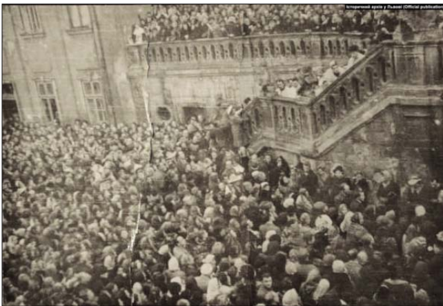
Попрощатись із митрополитом Андреем Шептицьким до Святоюрського собору з 1 до 5 листопада 1944 року приходили тисячі українців і поляків, не боячись радянської влади

Восени 1941 року за клопотаннями А. Шептицького й УЦК (Українського центрального комітету) почали відпускати додому полонених українців зі «Шталагу» – усього 1561 особу. У листопаді ці звільнення припинили. На той час у концтаборі вже бушували інфекційні хвороби. Німецька охорона дозволяла священникам відвідувати полонених, але охочих було мало, у цей час у таборі почалась епідемія тифу. Тоді Митрополит А. Шептицький звернувся до ігуменів монастирів зі словами: «Я не можу просити парафіяльних священників, бо вони мають сім'ї. Звертаюся до вас» ( http://www.cssr.lviv.ua ).