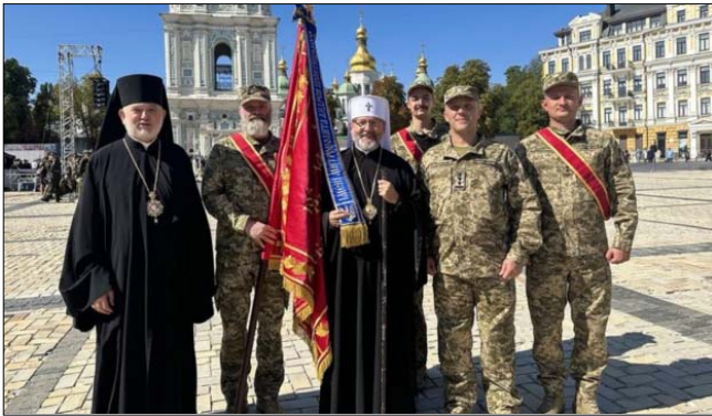
Блаженніший Святослав і владика Йосиф Мілян з бійцями 103-ї бригади ТрО імені Митрополита Андрея Шептицького, Київ, 24 серпня 2024 року.

Це перша бригада територіальної оборони Сил територіальної оборони Збройних сил України, якій присвоєно почесне найменування. Ця бригада є важливим формуванням Сил територіальної оборони Збройних сил України та представляє Львівську область. Вона була створена для забезпечення безпеки та оборони цієї області та України загалом. Бригада перебуває у складі Регіонального управління Сил ТрО «Захід». Глава УГКЦ Блаженніший Святослав зустрівся з бійцями 103-ї окремої бригади ТрО імені Митрополита Андрея Шептицького і привітав їх із цією почесною відзнакою [23].