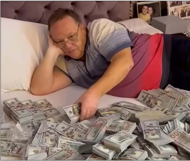
Вдома у сім'ї Крупи виявлено $5,2 млн, 300 тис. євро, понад 5 млн грн, брендові прикраси та коштовності.

тівкою майже $6 млн. Також за кордоном у власності родини перебуває нерухоме майно в Австрії, Іспанії та Туреччині. На валютних закордонних рахунках родина також «накопила» майже $2,3 млн»; «На Харківщині відкрили велику схему ухилення від мобілізації: затримано 13 медичних посадовців... Правоохоронці провели 89 обшуків у рамках розслідування, під час яких вилучили документи, чорнові записи, мобільні телефони, комп'ютерну техніку, а також понад 500 тисяч доларів, майже 80 тисяч євро, понад 1 мільйон гривень та російські рублі»; «Вилучено підроблених печаток і штампів: СБУ відкрила ділків, які заробили на ухилянтах понад 40 млн грн».