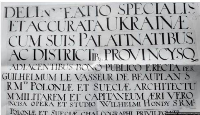
Аркуш з назвою Спеціальної мапи України Гійома де Боплана 1650 року. Цей примірник зберігається в Національній бібліотеці в Парижі

Але південна орієнтація Спеціальної мапи (як також і Генеральної мапи Боплана) могла переслідувати й іншу ціль – так легше послугоуватись мапою і вести бойові дії з противником, який перебуває на півдні.