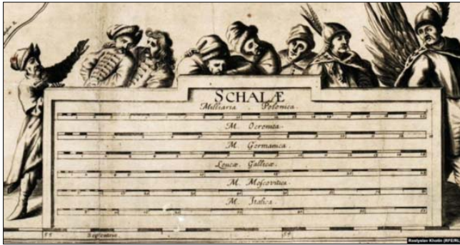
Показник відстаней одиницями довжини різних країн на Спеціальній мапі Боплана. Друга згори – українська «Окреника»

Це до того, що фактично кожен зі збережених примірників Великої мапи є по-своєму унікальним.