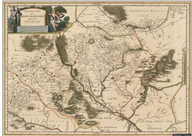
Мапа України «Частина України, Київське воєводство» (Ukrainae pars quae Kiouia Palatinatus vulgo dicitur) Гійома Левассера де Боплана. Ця мапа створена на основі частини Спеціальної мапи України

лині. Також багато людей прочитали його книжку – принаймні бачили її назву. А пізніше до позначення України в Європі додалось ще означення «Козацька земля» або «Земля козаків», – каже Володимир Дмитерко.