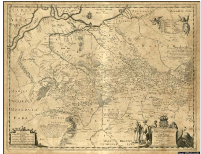
Генеральна мапа України французького військового інженера та картографа Гійома Левассера де Боплана, 1648 року. Назва: Delineatio generalis Camporum Desertorum vulgo Ukraina: cum adjacentibus provinciis . Генеральна мапа теж рідкісна, але не так, як Спеціальна мапа

А вже того року почалась війна українських козаків проти Польщі під проводом гетьмана Богдана Хмельницького, а королем вже був Ян Казимир. То вже – і тут якийсь парадокс – після 1650 року (коли війна була в розпалі) по Спеціальній та Загальній мапах України могли вестись і тогочасні бойові дії козацької війни.