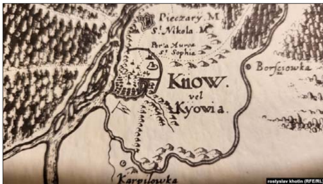
Київ на Спеціальній мапі України Гійома Левассера де Боплана 1650 року

Спеціальна мапа стала раритетною вже у 18-му столітті. Володіти нею вважалося престижним – це була одна з найбільших мап того часу.