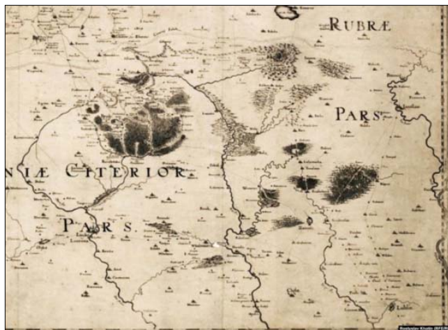
Аркуш номер 8 Спеціальної мапи України Боплана і Гондїуса, на якому позначено Львів, зазнав чи не найбільше змін під час гравірування в Іданську в середині 17-го століття

Спеціальна мапа України відіграла свою історичну роль ще й тому, що фіксувала назву «Україна» стосовно українських земель.