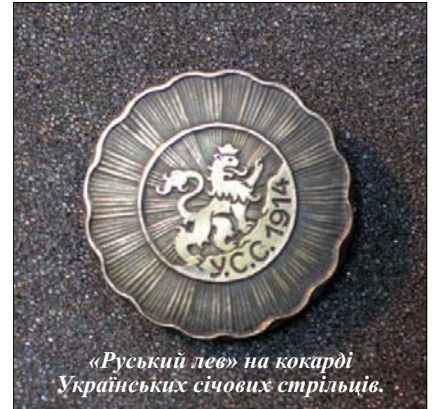
«Руський лев» на кокарді Українських січових стрільців.

3 вересня 1914 р. в Стрию січовики склали присягу Австро-Угорській імперії [5]. Та стрілецьтво склало й іншу, набагато важливішу, присягу рідному народові: « Я, ..., Український Січовий Стрелець, присягаю українським князям, гетьманам, Запорізькій Січі, могилам і всій Україні, що вірно служитиму Рідному Красві, боронитиму його перед ворогом, воюватиму за честь української зброї до останньої краплини крові. Так мені, Господи Боже й Архангеле Михаїле, допоможіть. Амінь » [6].