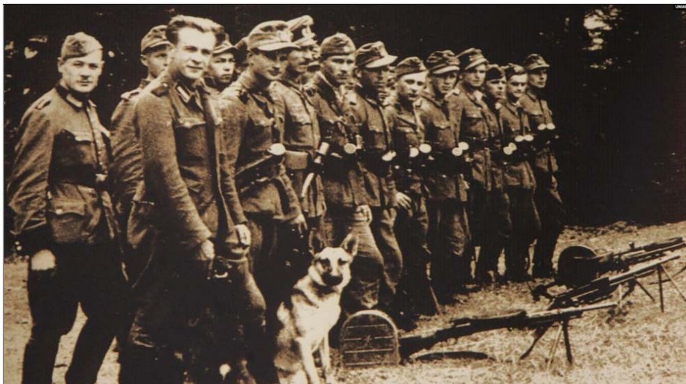
Бійці сотні УПА «Леви» при охороні Збору УГВР в липні 1944 року в селі Сприня Львівської області

«Воююча Україна» – таку філософську працю писав 1951 року, але не