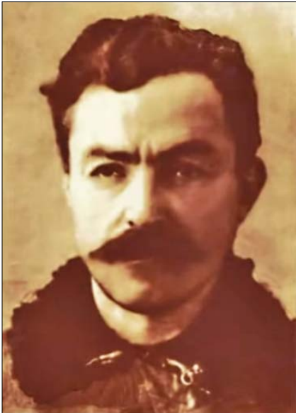
Кирило Осмак (1890–1960), президент Української головної визвольної ради (УГВР)

ротьбою, репрезентувати політичну боротьбу українського народу в Україні й за кордоном, створити український уряд і скликати перше українське всенародне представництво.