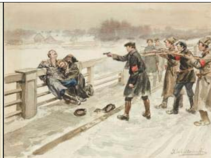
Художник Іван Владіміров. Очевидець жахить большевицького заклоту 1917 року

леграми в Харків Антонову-Овсієнку і Орджонікідзе: «Дуже й дуже просимо вжити якнайнешадніших революційних заходів. <...> Усіма засобами просувати вагони з хлібом у Петроград, інакше загрожує голод. <...> Ради бога! Ленін».