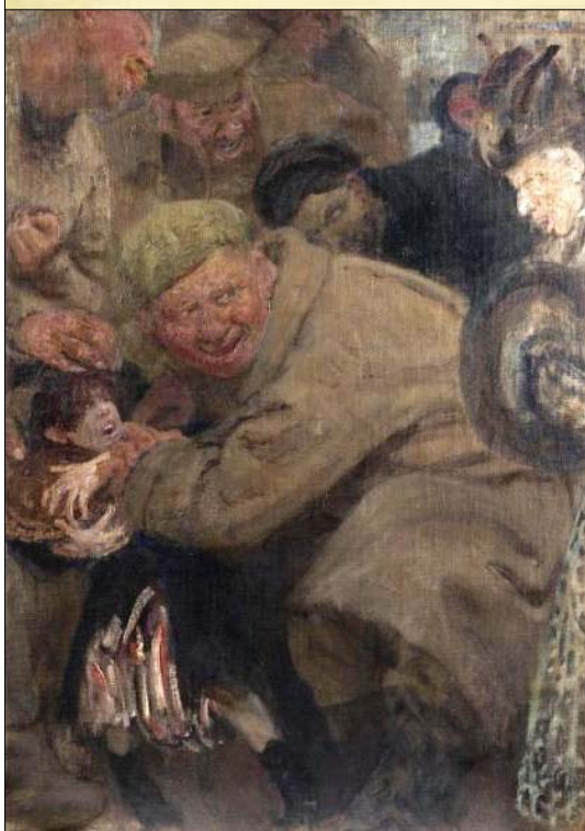
1918 рік. Художник Ілля Рєпін «Большевики» (варіанти назви: «Большевики. Красноармієць, що відбирає хліб у дитини», «Большевики. Солдати Троцького забирають у хлопчика хліб»).