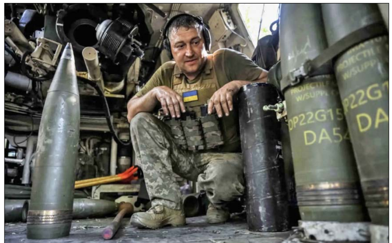
Український солдат біля снарядів у Донецькій області, серпень 2023 року.

За Порошенка Україна не вступила до НАТО і не по-