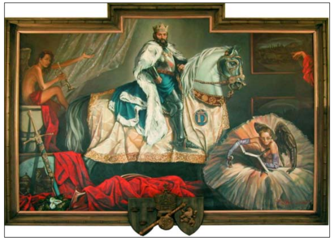
Король Данило. Художник Євген Равський

Тому в нас, українців, герой не Олександр «Невський», який підпорядкував владі монголів Новгород, а король Русі Данило Романович, який у складних умовах створив коаліцію для перемоги над Ордою. Отож, сьогоденні цивілізаційне прагнення України бути в сім'ї європейських народів природне й логічне в культурно-історичному плані.