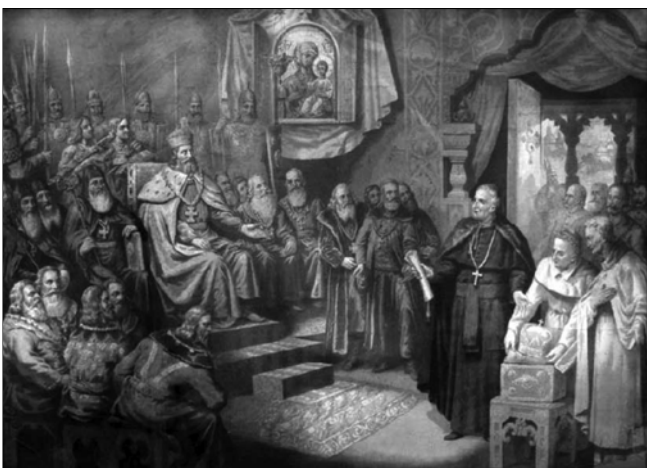
Коронація Данила Романовича. Картина А. Пилиповського

– Саме так. Україна-Русь – могутня держава європейського середньовіччя, творцем якої був український етнос. Королівство Русь (Галицько-Волинська держава) стало політичним та духовним спадкоємцем Київської Держави, її високих культурно-мистецьких надбань. 1238 року Данило Романович також повернув собі свій престол у Києві. Його держава була чи не найбільшою в тогочасній Європі – простягалася від Бугу аж до самого Дніпра. Данило Романович погодився на коронацію та об'єднання Руської митрополії з Римом, сподіваючись на допомогу західноєвропейських монархів у боротьбі проти монголів. У той час отримати королівський статус і гідність королівську без згоди на те римського престолу було не можливо. У грудневу негодю 1253 року (за іншими даними – 7 жовтня), до Дорогичина прибули посланці Папи Римського Інокентія IV, яких очолював Опізо. Урочиста коронація нового монарха Європи відбувалася в дорогичинському храмі Пресвятої Богородиці. Легат Опізо поклав на голову князя королівську корону, сповістивши про виникнення нової держави – Королівства Русі.