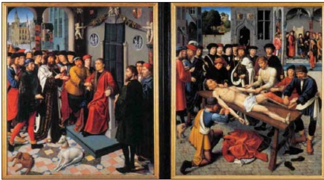
Дитячі Герарда Давіда «Суд Камбіса»

Держава і суспільство зазнають особливо великих збитків через зловживання суддів, ухвали яких контролюються лише рішеннями вищих судових інстанцій, тобто тим же суддівським корпусом, що, як і нижчий, може бути корумпований.