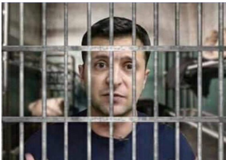
Майбутнє Зеленського, якщо не піде у відставку і не виїде до Ізраїлю

У статтях ви ознайомитися з Присудом («вироком») Народного трибуналу, який визнав Зеленського Володимира Олександровича ВИННИМ по всіх пунктах звинувачення: