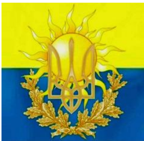
Вселенський (Божественний) Символ Перемоги України

Рани загоїте і все відбудуєте лише за нового свого правителя — Воїна Світла Переможця. Поверніть своїй землі-матері її справжнє ім'я — Русь-Україна і підняти треба над нею її Вселенське жовто-блакитне знамено (золоте — духовне зверху, голубе — матеріальне знизу, а не навпаки, як зараз, тому і занепадаєте). І розквітне благословенна Творцем ваша земля Русь-Україна, здобуде свою минуло міць, силу і славу...».