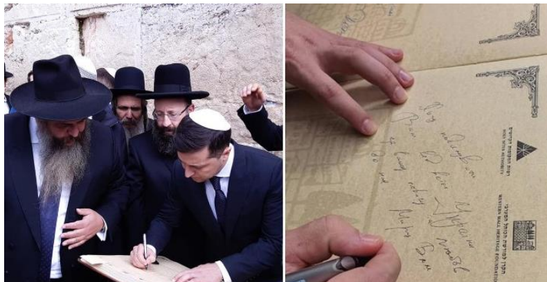
На фото: Зеленський у білій кіпі (ярмулці) біля Стіни Плачу робить запис у книзі поважних гостей

Нагадаю, що під час робочого візиту в Ізраїль у січні 2020 року Зеленський написав у книзі поважних гостей Стіни Плачу такі слова: «Хочу подякувати Вам від всієї України за вашу повагу та любов до нас. Миру Вам» (на фото).