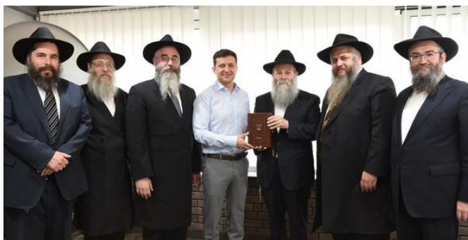
Рабини подарували президенту України Зеленському видання єврейської Тори

https://www.youtube.com/watch?v=yyWeMPWRdtU&feature=youtu.be ).