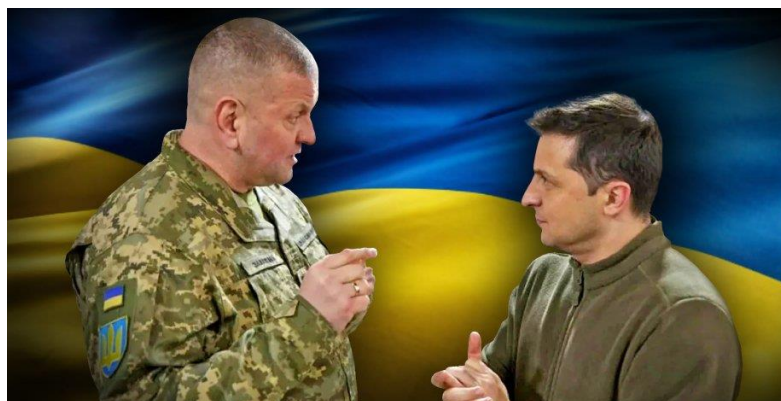
Генерал Залужний дилетанту Зеленському: «Запам'ятай: я планую операції, ти записуєш відосики. У військові справи свого носа не сунь. Зрозумів?»

Переважна більшість українців, 78% вважають, що президент України Зеленський несе пряму відповідальність за корупцію в уряді та воєнних адміністраціях. Це засвідчило опитування, проведене Фондом «Демократичних ініціатив» ім. Ілька Кучеріва спільно з Київським міжнародним інститутом соціології у липні 2023 року, Лише 18% опитаних не згодні з цією думкою.