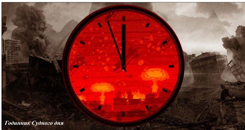
Годинник Судного дня

Один з далеkobійних засобів, які РФ використовує на Заході, – страх виборця перед Апокаліпсисом. Він спрацьовує, про що свідчить позиція країн-членів НАТО на Вільнюському саміті. Найменше тут «винні» вояки