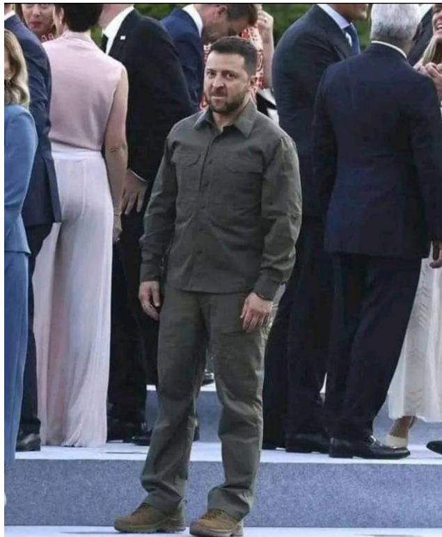
Саміт НАТО — це не «Квартал 95»...

На саміті НАТО Зеленський впіймав облизня і побачив справжнє ставлення до себе (на фото).