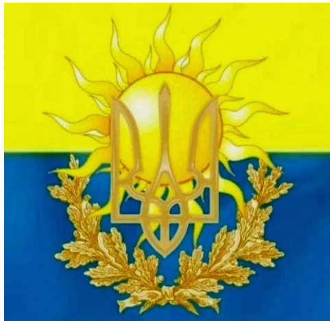
Вселенський (Божественний) Символ Перемоги України

УкРАїнці, ПЕРЕМОГА у ваших руках і вона потрібна, в першу чергу, вам! Зробіть запропонований мною перший крок 23 серпня. Хай в цей День в УкРАїні і по всьому світу замайорять БОЖЕСТВЕННІ ЖОВТО-БЛАКИТНІ ЗНАМЕНА УКРАЇНСЬКОЇ ПЕРЕМОГИ!