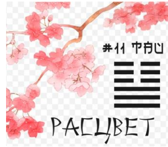
Гексаграма «Тай» («Розквіт», «Розвиток», «Щастя»)

Тоді як обернене розміщення барв, коли ЖОВТЕ (Божественне, Духовне) розташоване вгорі, а синє – внизу, утворює цілковито іншу гексаграму «Тай», яка означає: «Розквіт. Мале відходить. Велике приходить. Щастя. Розвиток».