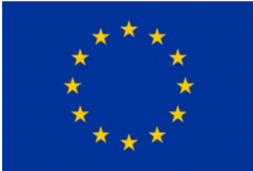
Прапор Європейського Союзу, прийнятий 8 грудня 1955 року

Символіка прапора ЄС має в своїй основі християнський зміст. Впадає в око, що коло із дванадцяти зірок на прапорі нагадує відомий у сакральному мистецтві ореол навколо голови Матері Божої. Поль М. Г. Леві, на той час шеф інформаційної і пресової служби Ради Європи, який брав участь у виборі прапора і наданню йому остаточного вигляду, заявив, що це випадковість. Проте автор прийнятого проєкту прапора Арсен Гейтц перед смертю визнав, що створюючи його, надихався фрагментом Апокаліпсису Святого Івана, та що взірцем для нього було зображення Матері Божої Непорочно Зачатої, яка власне представлена на лазуровому тлі, а її голову оточує 12 зірок.