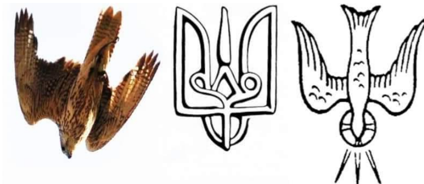
СОКІЛ — Сонячний символ Перемоги

«СОКІЛ — це Сонячний символ Перемоги. Символізує перевагу, сильні вольові якості, дух, світло, свободу». (див. Символи. Знаки. Емблеми. — Сост. В. М. Рошаль. — М.: Эксмо, 2005. — С. 478).