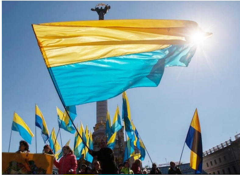
Божественний ЖОВТО – БЛАКИТНИЙ стяг Перемоги укРАїни

«ПЕРЕМОГА під БОЖЕСТВЕННИМ ЖОВТО – БЛАКИТНИМ СТЯГОМ або подальший ЗАНЕПАД під перевернутим «вверх ногами» державним синьо–жовтим прапором. Вибір за вами, укРАїнці!», - Герой України, генерал Григорій ОМЕЛЬЧЕНКО