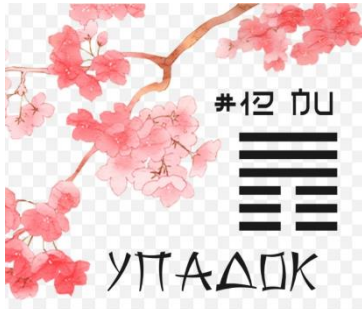
Гексаграма «Пі» (Занепад», «Руйнація», «Загибель»)