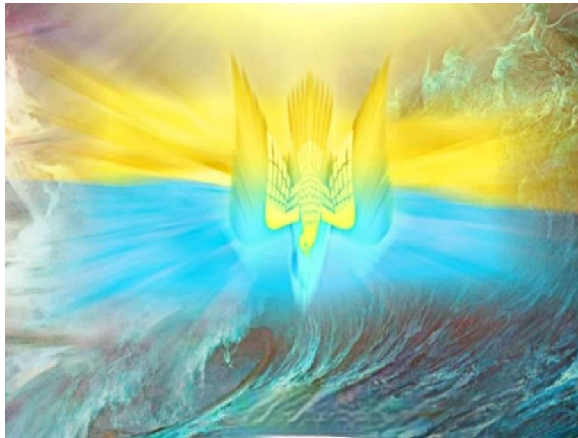
Птахом Творця Всесвіту в арійській традиції завжди був СОКІЛ.

«Сокіл — Сонячний птах, духовне єство світотворення. Він сидить на вершечку світового древа, поряд із небесними світилами, й відає про все. На витворах народного мистецтва зображена космогонічна картина: сокіл на верхівці прадерева, ВІН СТВОРЮЄ НОВИЙ СВІТ. У колядках змальоване дерево, "а на вершечку сив соколонько гнізденько си в'є", щоб знести яйце, в якому зародиться життя.