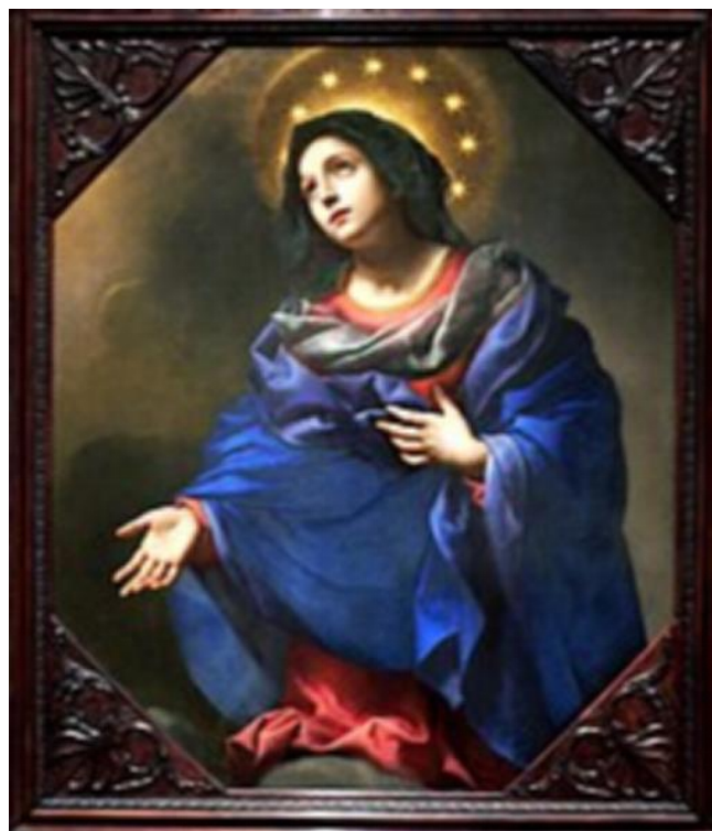
Зображення Матері Божої Марії

Символіка прапора ЄС має в своїй основі християнський зміст. Впадає в око, що коло із дванадцяти зірок на прапорі нагадує відомий у сакральному мистецтві ореол навколо голови Матері Божої. Поль М. Г. Леві, на той час шеф інформаційної і пресової служби Ради Європи, який брав участь у виборі прапора і наданню йому остаточного вигляду, заявив, що це випадковість. Проте автор прийнятого проєкту прапора Арсен Гейтц перед смертю визнав, що створюючи його, надихався фрагментом Апокаліпсису Святого Івана, та що взірцем для нього було зображення Матері Божої Непорочно Зачатої, яка власне представлена на лазуровому тлі, а її голову оточує 12 зірок.