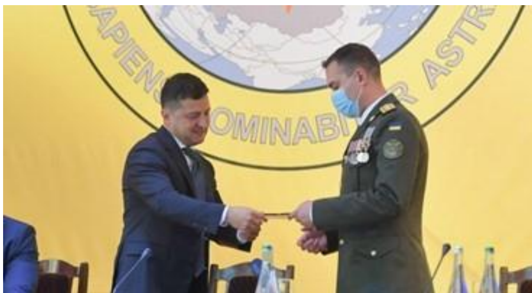
На фото: Зеленський представив нового начальника ГУР МО Буданова

Не прислухавшись до порад професіонала, без будь-яких пояснень, обґрунтувань і мотивів Зеленський 5 серпня 2020 року своїм указом №307/2020 тупо звільнив Бурбу з посади начальника ГУР МОУ і на його місце призначив 34-річного Кирила Буданова, особу без будь-якого управлінського і аналітичного досвіду роботи на керівних посадах в розвідці. Безпрецедентний випадок в історії розвідки України.