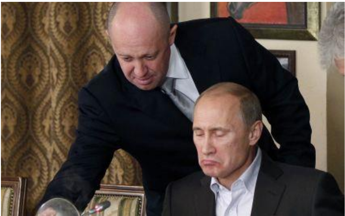
На фото Associated Press: господар-педофіл путін і його лакей-педераст пригожин (в ресторані)

Минуло два тижні, як безславно завершився так званий «марш справедливості на москву» евгенія пригожина. Коментарі з цього приводу висловили всі хто бажав, починаючи від вітчизняних і зарубіжних політиків і закінчуючи різними експертами. Повторювати не буду, все це можна знайти в Інтернеті.