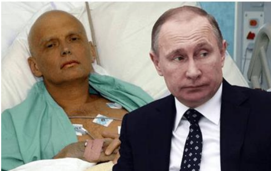
Олександр Литвиненко і його вбивця-педофіл путін

Виконавцями отруєння Литвиненка суддя визнав “колишнього співробітника спецслужб СРСР і РФ (добре знайомого Литвиненка) Андрія Лугового і бізнесмена Дмитра Ковтуна, які разом прибули до Лондона із “полонієм-210” для отруєння Литвиненка.