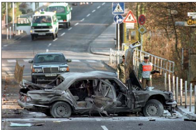
Зруйнований лімузин вбитого керівника Deutsche Bank Альфреда Герргаузена (1989 рік, Бад-Гомбург)

надають достовірності заявам цієї людини». Белтон залишила відкритим питання, що саме за документи це були.