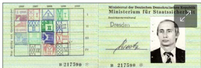
Перепустка працівника КГБ Путіна від Штазі

У 1985 році, як стверджує Ц., він познайомився з росіянином на ім'я «Володя» під час корпоративної спортивної зустрічі у Штазі. Вони ходили один до одного в гості, їздили на екскурсії. Пізніше, зазначає Ц., він дізнався, що «Володя» був зв'язковим «Шорша» в КГБ. І коли в якийсь момент став очевидним кінець НДР, вони разом обмірковували, чи може Ц. відтепер працювати на КГБ у якості конспіратора, але насправді цього ніколи так і не сталося.