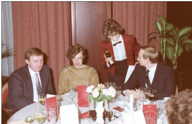
З часів перебування Путіна в Дрездені розповідають, що він особливо цінував пиво Radeberger, яке було важко дістати звичайним громадянам НДР