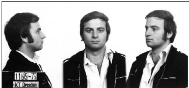
Заарештований Райнер Зоннтаг (фотографія Народної поліції НДР). Фото: BStU

Вперше ці захоплюючі історії стали надбанням громадськості на початку 2000 року, коли Путін став президентом Росії, і легіони репортерів вирушили на пошуки зачіпок до його минулого. Британська газета «Sunday Times» повідомила про «кільце з 15 агентів», яке нібито створив Путін. Німецьке видання «Sächsische Zeitung» писало, що серед тасмних агентів був сумнозвісний дрезденський неонацист Райнер Зоннтаг, якого застрелили в 1991 році. А в газеті «Welt» можна було прочитати про східнонімецького лікаря, якому путінські агенти нібито хотіли підкинути «порнографію з молодими дівчатами», аби змусити його ввести в комп'ютерну мережу неправдиві дані про «хімічну війну».