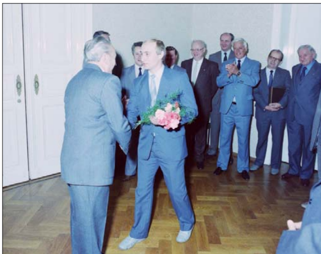
Офіцер КГБ Путін у НДР у 1980-х роках (фото без дати)

На зустрічі з Фасбендером у серпні 2021 року Дітмар К. знову розповів про ймовірні терористичні зібрання в Дрездені, прикрасивши їх додатковими деталями. Він заявляв, що в тасмних зустрічах брав участь не лише Путін, але й Сергій Іванов, який пізніше став міністром оборони Росії. Крім того, іноді там були присутні терористи з французької «Action directe» («Пряма дія») або керівник дрезденського окружного управління Штазі генерал-майор Горст Бьом. Путін, який мав псевдонім «Вова», іноді «посилав його за кавою».