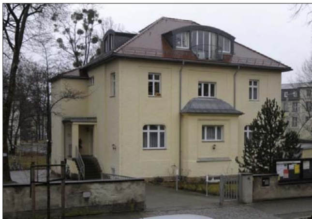
Колишня штаб-квартира дрезденського відділення КГБ, де Путін працював у 1985-1990 роках