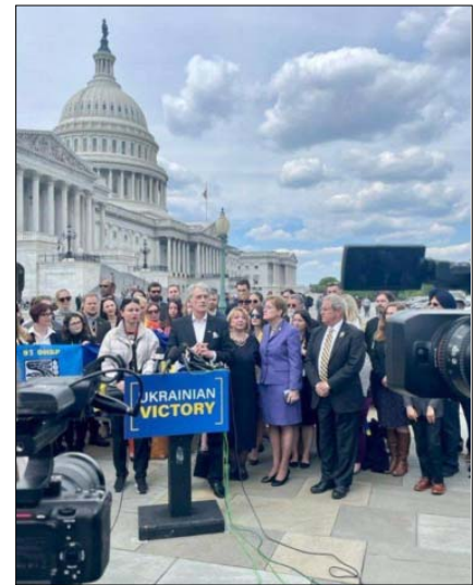
Поява колишнього президента України Віктора Ющенка на політичних заходах у Вашингтоні з приводу законопроекту «Про перемогу України» – поганий знак для Зеленського. Це означає, що США шукають нейтральну політичну постань для початку якогось політичного процесу

Треба визнати, що особливої довіри до існуючої в Україні системи влади немає. Її представники, декларуючи реформи, не дотримуються жорсткості у виконанні поставлених завдань, відходять од міжнародно визнаних норм, частенько вдаючись до мухлювання та фальсифікацій. У ви-