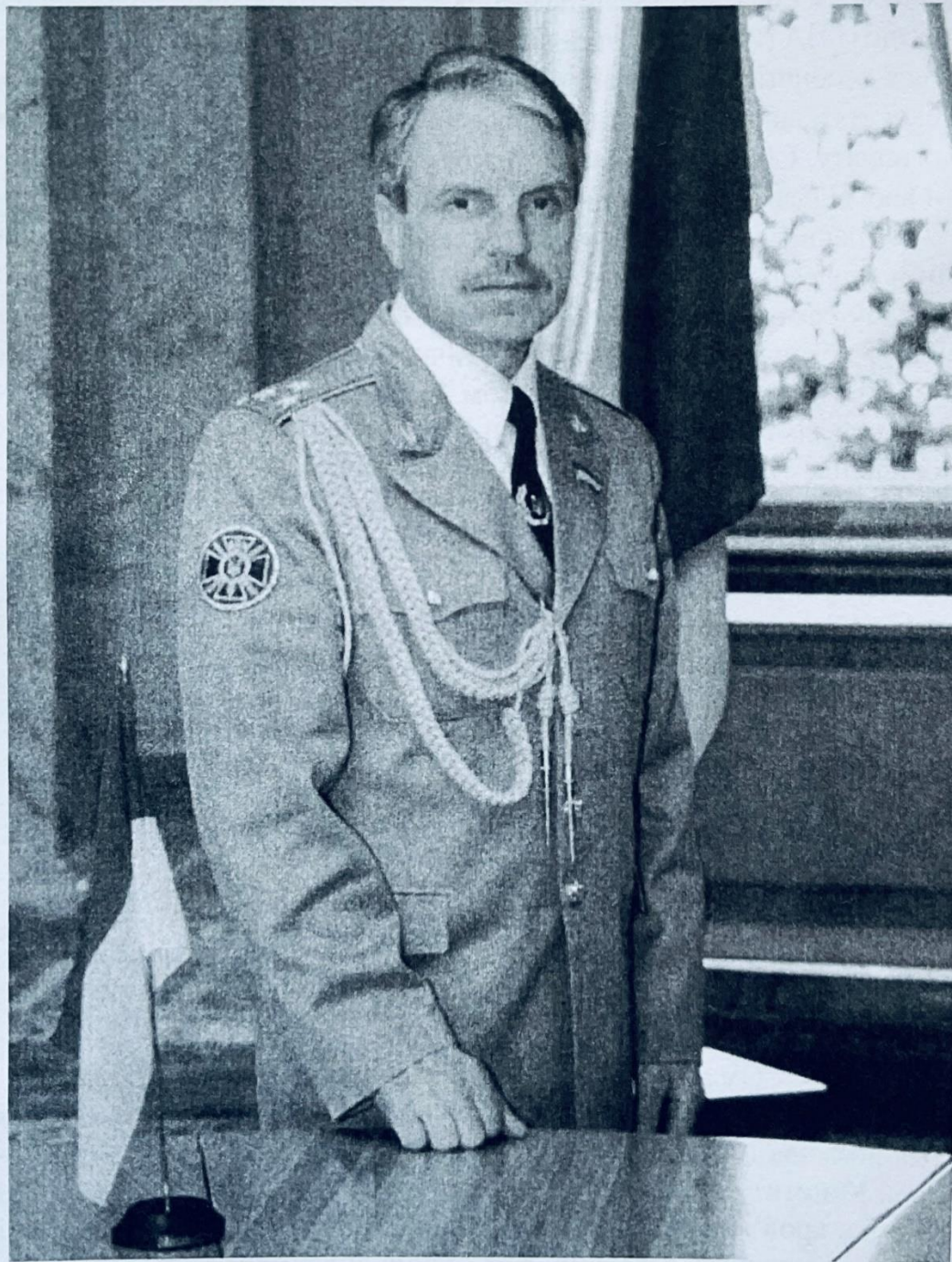
Полковник Григорій Омельченко – керівник офіцерської організації і депутатської групи «Антимафія» (1992–2002 рр.)

запозичене в італійській мафії, про те, що «кращий свідок – мертвий свідок». «Але ж, – каже генерал Омельченко, – окрім земного суду, є ще й суд Божий. І він – безкомпромісний, він хабарів не бере!».