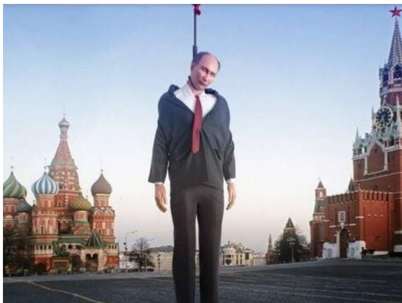
The Tiger Lillies та The Hypnotunez зобразили путіна у новому кліпі з петлею на шиї.

Акт капітуляції російської федерації підписують представники російської влади (які не вчинили злочину агресії проти України) без участі путіна (який на момент підписання повинен бути арештований або повішений/вбитий), Україна як країна Переможець і лідери країн "антипутінської коаліції".