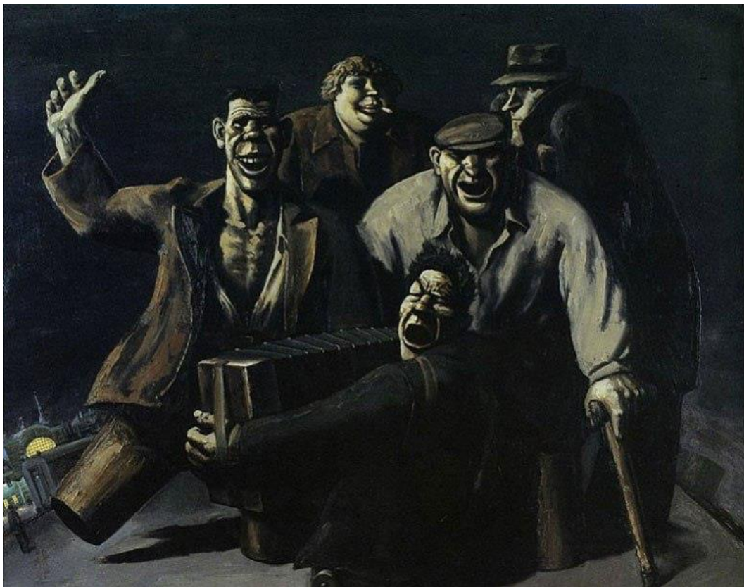
Художник Василій Шулженко