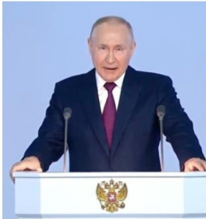
Московський фюрер путін під час панахиди