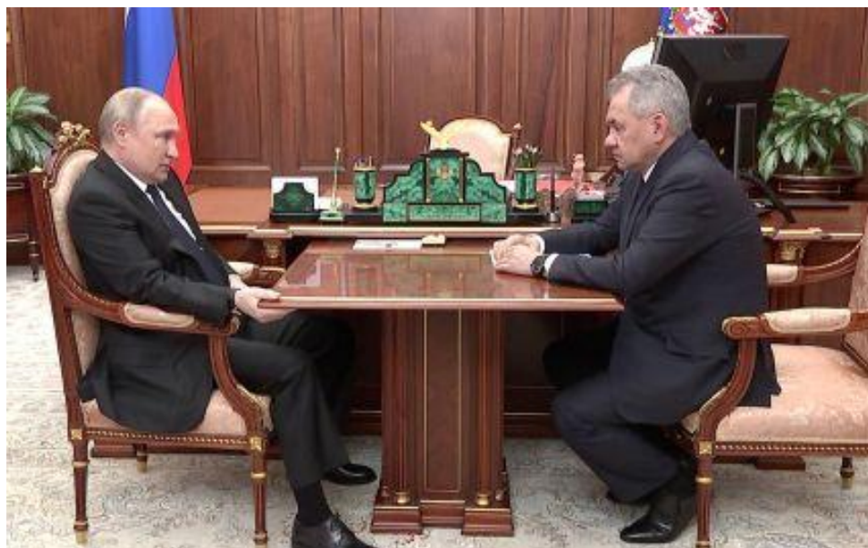
21 квітня 2022 р. шойгу доповідає путіну про хід «операції»

Більше того, експерти встановили: ЙМОВІРНІСТЬ того, що «путін», який виступав у залі 21 лютого, і «путін», який 21 квітня 2022 року слухав доповідь міністра оборони шойгу, одна і та сама особа – дорівнює не більше 84%, а того, хто кричав на стадіоні «ура» – 81%.