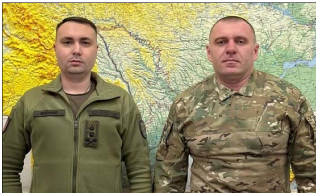
Кирило Буданов і Василь Малюк

Те, що Кіреєв не міг бути російським шпигуном є думкою цивільної людини. Нехай і «государевої». Дивує інше. 23 січня 2023 року пресслужба СБУ повідомила, що очільник СБУ Василь Малюк та керівник ГУР МО Кирило Буданов провели спільну робочу нараду. В телеграмканалі ГУР повідомило: «Чутки про нібито непорозуміння між керівниками ГУР МО України та СБУ – ворожі наративи, які спростовуються щоденно спільною роботою зі знешкодження ворога» ( https://t.me/DIUkraine/1901 ).