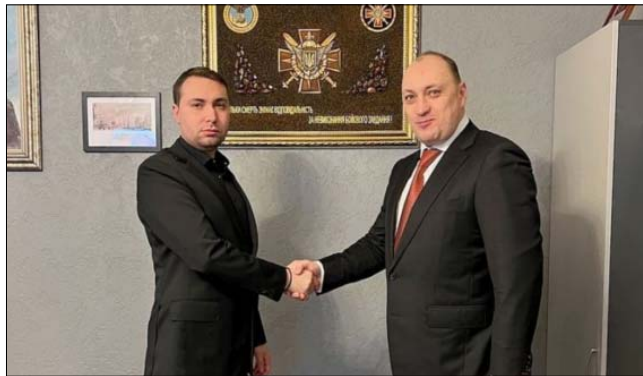
Буданов і Кіреєв

якого вбили в автівці СБУ, а тіло викинули на вулицю». Інтерв'ю з Кирилом Будановим ( https://www.radiosvoboda.org/a/%D0%B2%D0%B1%D0%B8%D0%B2%D1%81%D1%82%D0%B2%D0%BE-%D0%BA%D1%96%D1%80%D1%94%D1%94%D0%B2%D0%B0/32233661.html ) очільник ГУР однозначно заявив: «Я, як керівник спецслужби, впевнений (!), що людина, яка була нашим співробітником, не була шпигуном. Це, по-перше. По-друге, я пана Кіреєва особисто знаю з 2009 року. Він досить багато років співпрацював з усіма колишніми керівниками нашої структури. На одному з таких заходів, коли я ще був молодим офіцером, вперше в житті я його і побачив».