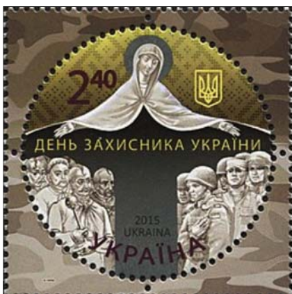
Поштова марка «День захисника України». Дизайн: Володимир Таран

УГКЦ за новим календарем святкуватимуться такі свята: Різдво Христове – 25 грудня, Богоявлення – 6 січня, Благовіщення Пресвятої Богородиці – 25 березня, Покров Пресвятої Богородиці – 1 жовтня , Святого Миколая – 6 грудня тощо. Парафії, які ще не готові до такого кроку, матимуть можливість з дозволу свого єпископа до вересня 2025 року святкувати нерухомі свята за старим стилем (Різдво Христове – 7 січня, Богоявлення – 19 січня, Благовіщення – 7 квітня тощо).