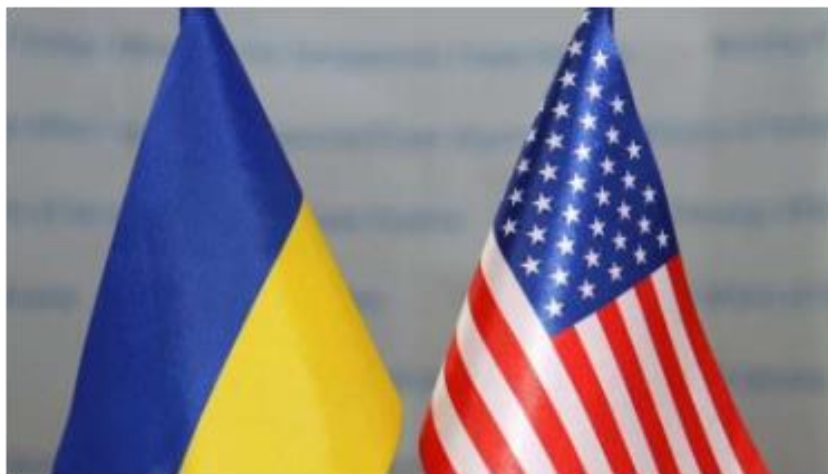
Прапори Свободи і Демократії

Містере Президенте , пишу Вам у бомбосховищі під час чергової масованої ракетної атаки москалів. Сьогодні (16 грудня) терорист путін запустив по нас 76 крилатих ракет. Напередодні атакував десятками іранських дронів-камікадзе. Зруйновано житлові будинки, об'єкти критичної інфраструктури, знеструмлено залізниці, міста, села. Є загиблі й поранені, серед них діти. Не американські — українські. Люди залишилися без води, світла, тепла. На вулиці мінусова температура. В домівках холодно.