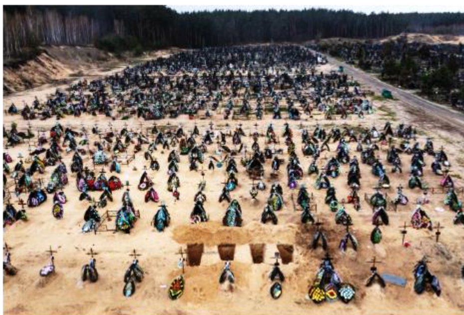
Сотні свіжих могил дітей, жінок, людей похилого віку в Ірпені, вбитих російськими окупантами

Зауважу, що злочини вчинені путіним в Україні не зрівняні зі злочинами, скоєними Мілошевичем в Косово. Те, що було виявлено в Бучі, Ірпені, Гостомелі та інших містечках і селах Київської області після звільнення їх від російських окупантів не підлягає визначенню і розумінню!