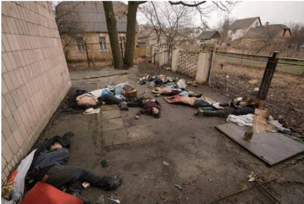
Буча. Мирні жителі. Закатовані і розстріляні російськими окупантами.

Містере Президенте , за час повномасштабної воєнної агресії росії в Україні загинуло щонайменше 450 дітей, поранено — понад 840, близько 240 — пропали безвісти, серед загиблих є зовсім немовлята, які прожили на білому світі добу-дві. Не американських, а українських дітей... Путінськими виродками-нелюдами вбиті десятки тисяч беззбройних людей.