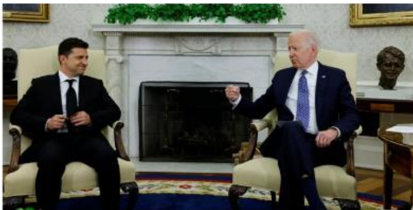
Вашингтон. 1 вересня 2021 року. Перша зустріч президентів України і США Володимира Зеленського і Джо Байдена в Овальному кабінеті Білого дому.

Український народ і ЗСУ, які є єдиним міжнародним суб'єктом України. Це єдине, на що може погодитися Україна і підписати акт капітуляції з росією в присутності керівників США, Великої Британії, Німеччини, Франції, Польщі та інших країн за їх бажанням, які засвідчать капітуляцію московії.