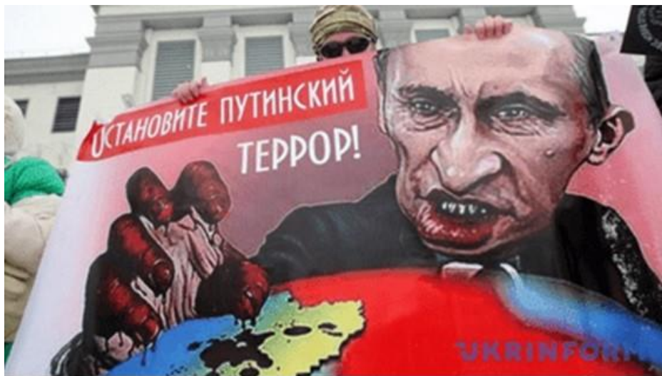
Світ вимагає зупинити путінський терор

«Фашисти майбутнього будуть називати себе антифашистами» (Г'юї Лонг, сенатор США в 1932-1935 рр. Вислів помилково приписується Уїнстону Черчиллю)