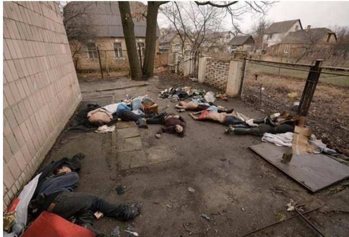
Буча. Мирні жителі. Діти, дівчата, жінки. Закатовані. Згвалтовані . Розстріляні.