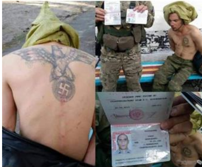
На фото: військовополонений москаль-нацист