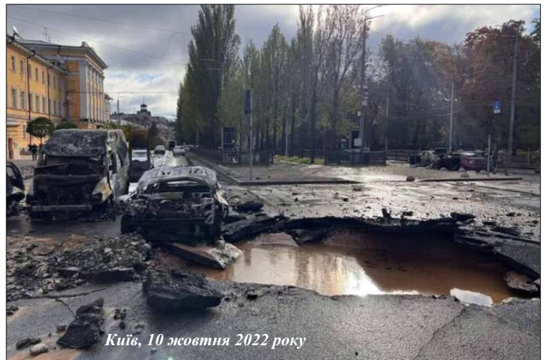
Київ, 10 жовтня 2022 року

Ян ВАЛЕТОВ, український російськомовний письменник