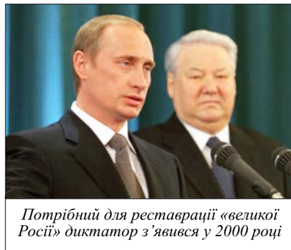
Потрібний для реставрації «великої Росії» диктатор з'явився у 2000 році

11 липня 2016 року в інтерв'ю німецькому виданню Der Spiegel Сергій