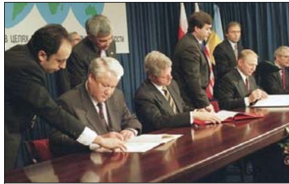
Підписання Будапештського меморандуму у 1994 році

Цинізм головного російського дипломата вражає. Адже у Статті 2 Меморандуму чітко сказано: «РФ, Британія і США підтверджують своє обов'язальство воздерживаться от угрозы силой или ее применения против территориальной целостности или политической независимости Украины, и никакое их оружие никогда не будет использоваться против Украины». Сформульовано однозначно: НІЯКА ЗБРОЯ, НІКОЛИ НЕ ВИКОРИСТОВУВАТИ-МЕТЬСЯ ПРОТИ УКРАЇНИ.