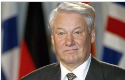
Борис Єльцин визнав, що обговорював з військовими можливість ядерного удару по Україні

Коли Україна заявила про своє природне право мати національне військо, на сторінках «Независимой газеты» у жовтні 1991 року з'явилось інтерв'ю з першим віце-прем'єром України Костянтином Масиком, який повідомив: «Єльцин обговорював з військовими можливість ядерного удару по Україні» . Реакція Бориса Єльцина на це інтерв'ю: «Я обговорював цю можливість з військовими, і для неї не має технічних можливостей» . Коментарі, як мовиться, зайві.