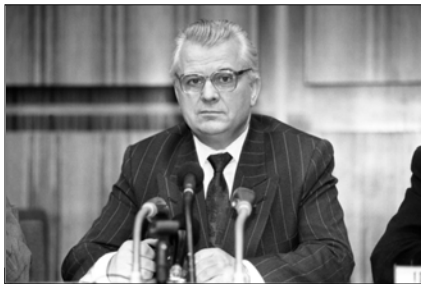
Леонід Кравчук відчував небезпеку від Росії, але йому також закидали провину в тому, що саме він позбавив Україну статусу ядерної держави

У травні 1992 року президент Леонід Кравчук в інтерв'ю італійській газеті «Стампа» слушно відзначив: « Припустимо, що ми вивеземо з України всю ядерну зброю і станемо без'ядерною державою. Ми цього й хочемо. Але які будуть гарантії нашої безпеки? Безпеку Німеччини, наприклад, гарантує НАТО. Хто ж буде забезпечувати безпеку України? Росія? Можливо, ми й були б згодні на це, але Росія постійно пред'являє нам територіальні претензії ».