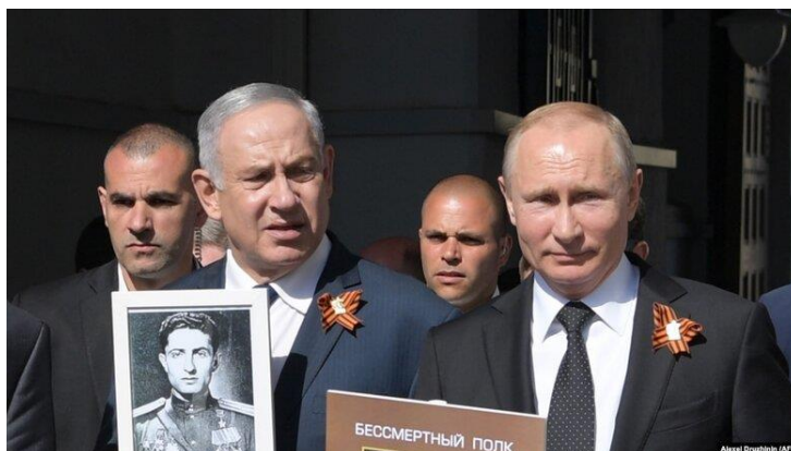
Нетаньяху і путін на акції «безсмертний полк» на Красній площі в Москві.

Як стверджують військові експерти, Нетаньяху показав путіну досить цікаву частину «Ядерного архіву», який викрала ізраїльська розвідка.