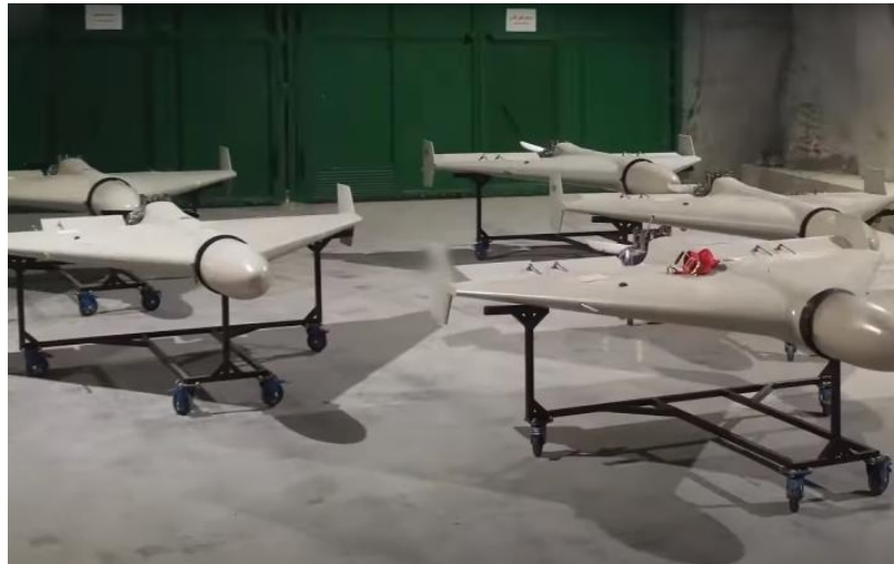
Цех заводу в Ірані зі збирання безпілотників «Shahed-136»

Після масованих атак іранських безпілотників «Shahed» Києва і обласних центрів України, топ темою стала загроза дронів-«шахідів» (камікадзе) і як її ліквідувати. Нагадаю, у липні-серпні експерти запевняли, що поставок безпілотників з Ірану в росію не буде, насміхалися з іранських «шахідів», недооцінювали їхні технічно-тактичні і бойові характеристики, зверхньо ставилися до їх руйнівних можливостей.