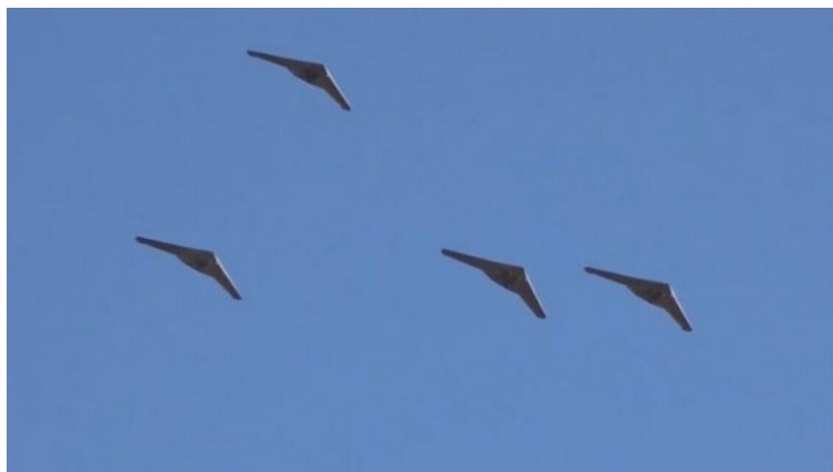
Групова атака іранських «шахідів»