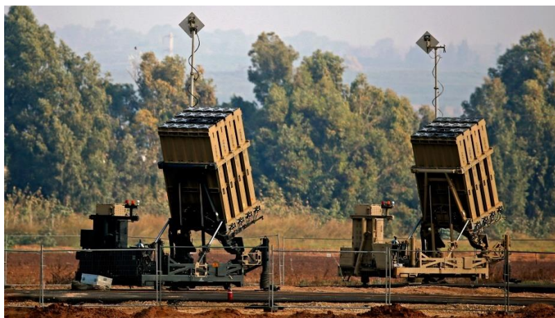
ПРО «Iron Dome» («Залізний купол»).

Україна заявляє, що зацікавлена якнайшвидше отримати для захисту цивільного населення такі системи ПРО/ППО: