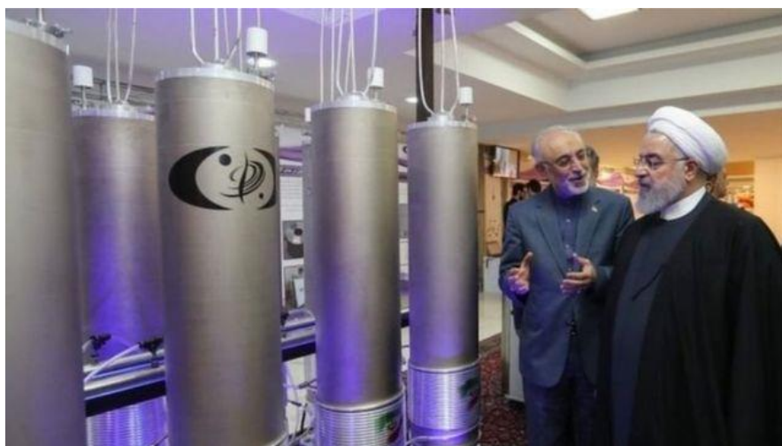
Аятола Хаменеї на одному з ядерних об'єктів Ірану по збагаченню урану

Тому я порадив працівникам РНБО, щоб вони запропонували президенту Зеленському звернутися до президента Байдена з проханням допомогти Україні знищити зміїні кубла «шахідів» - іранські заводи-виробники безпілотників і склади, де вони зберігаються, а одночасно вирішити проблему з ядерними об'єктами Ірану.