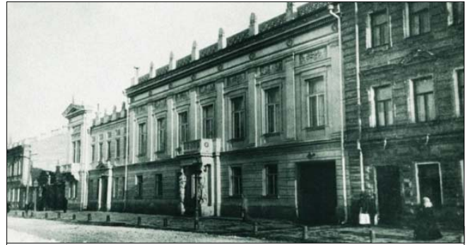
Давнє фото садиби Терещенків, де нині розташовується Національний музей «Київська картинна галерея»

карній яхті «Іоланді». А головне, що тут жив його вірний капітан, який встиг стати гарним приятелем, Бертон.