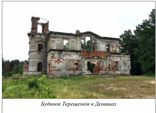
Будинок Терещенків в Денишах