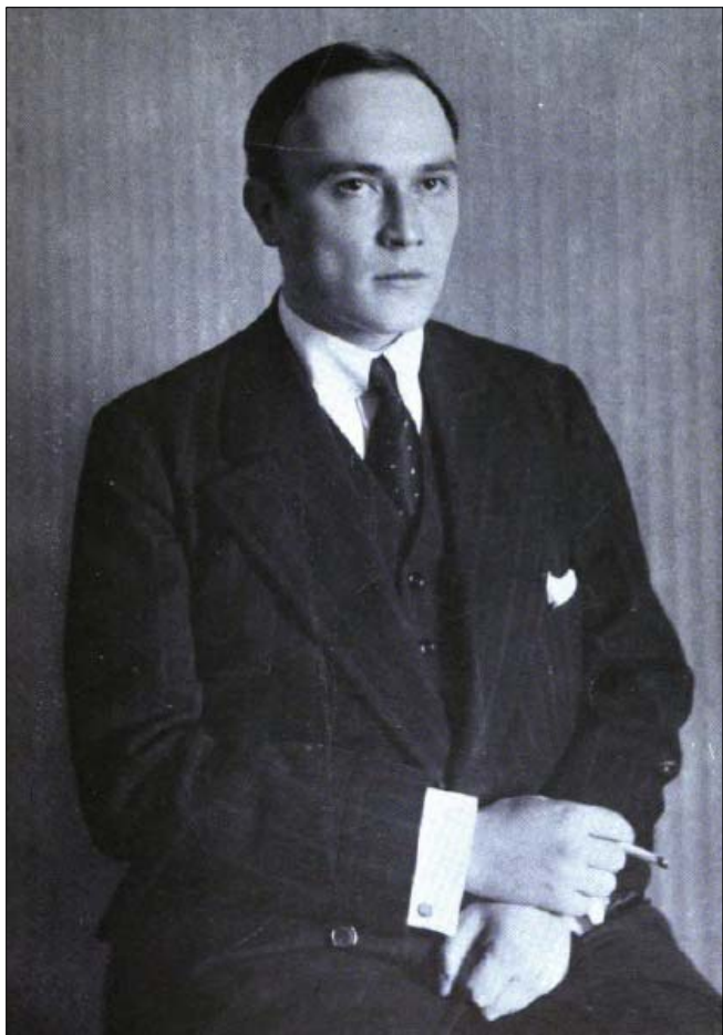
Міністр Тимчасового уряду Росії Михайло Терещенко

До 1914 року Михайло активно зосереджений на роз-