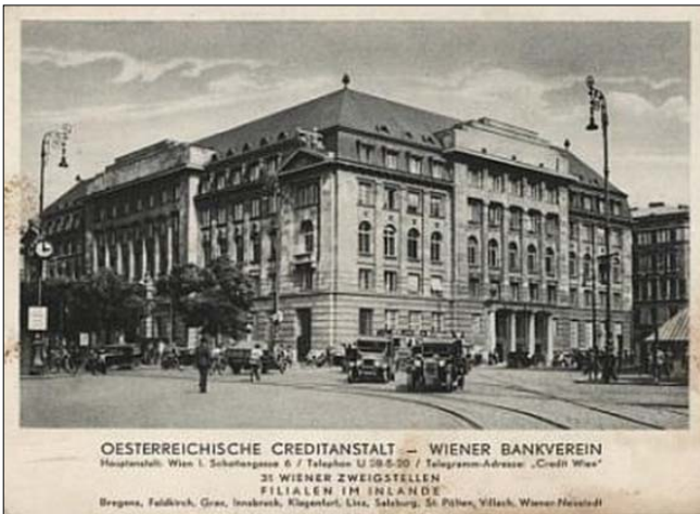
OESTERREICHISCHE CREDITANSTALT — WIENER BANKVEREIN Hauptniederl. Wien I, Schottenplatz 6 / Telephone U 28-5-20 / Telegramm-Adresse „Credit Wien“ 25 WIENER ZWEIFSTELLEN FILIALEN IM INNLAND Bregenz, Falditsh, Graz, Innsbruck, Klagenfurt, Linz, Salzburg, St. Pölten, Villach, Wamser Neustadt

День і ніч працював у Відні над тим, щоб забезпечити надійність банку, збереження активів і можливість розрахуватись з кредиторами.