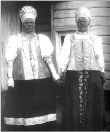
Девушки в праздничных нарядах. Архангельская губа. Российская империя, 1910 г.

шої абстрактної мети. Росія – яскравий приклад етнічної антисистеми.