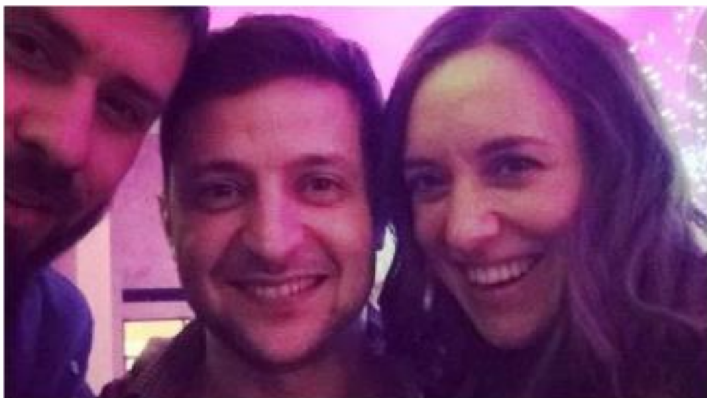
Гогілашвілі, його дружина Марія та президент Зеленський (в центрі)

Хто повірить в те, що це призначення відбулося без вказівки президента Зеленського?