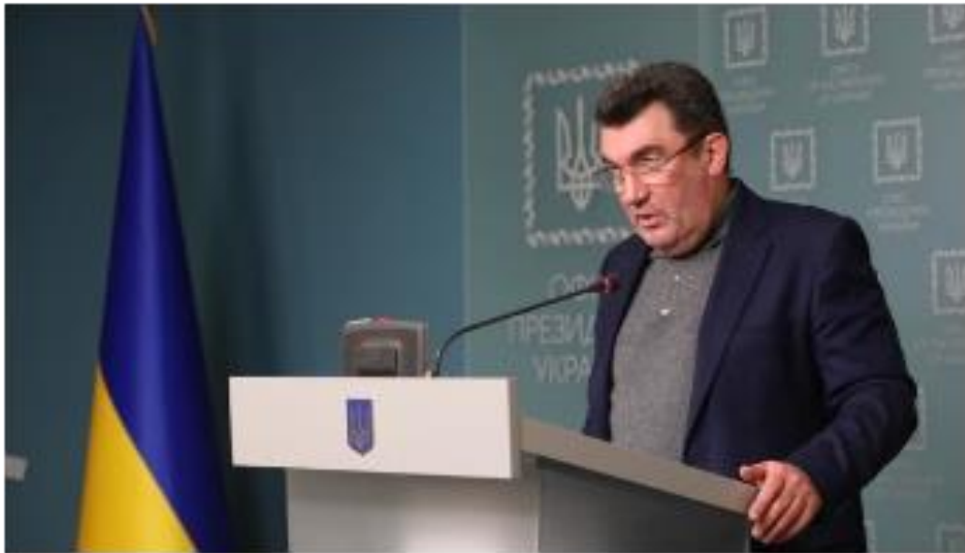
Данілов: «Причетні до прийняття «Харківських угод» відповідатимуть незалежно від прізвищ».