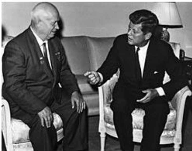
Микита Хрущов і Джон Кеннеді

Ситуація дуже нагадує «карибську кризу» – гостре протистояння між США і СРСР у жовтні 1962 року внаслідок таємного розміщення Радянським Союзом ядерних ракет на Кубі. Вперше в історії людства обидві наддержави наблизилися до прямого військового протистояння і безпосередньої загрози початку ядерної війни.