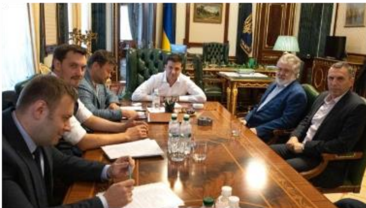
11 вересня 2019 р. На зустрічі, окрім президента Зеленського та Коломойського, були прем'єр, міністр енергетики, помічник президента Шефір та глава ОП Богдан, який був адвокатом Коломойського.

Викладене свідчать, що бізнес-структури Зеленського могли в період 2012-2019 років уникати сплати податків в Україні та відмивати кошти, викрадені Коломойським. А інформація про їхніх реальних власників була засекречена.