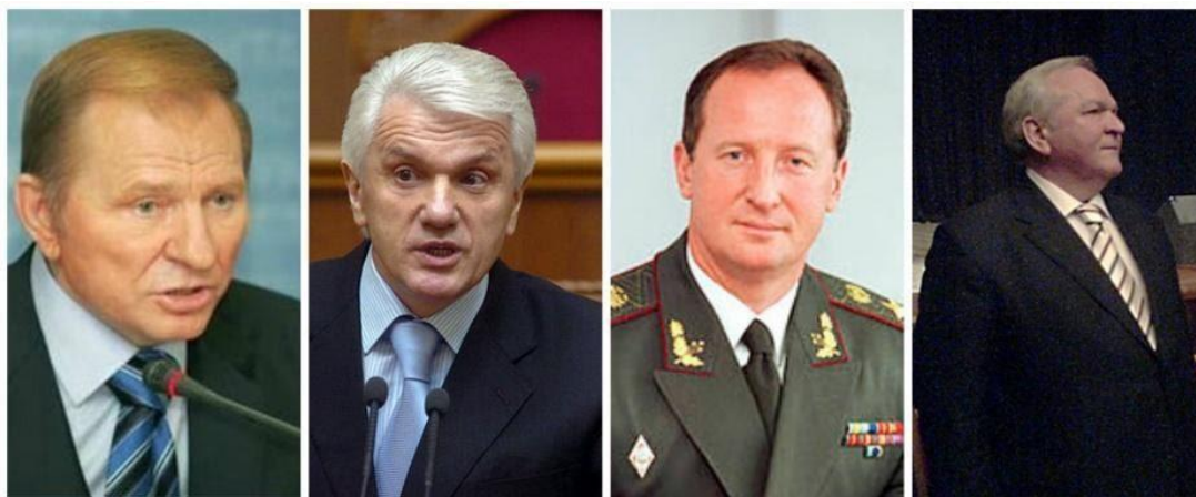
Л. Кучма Кравченко

За висновками ТСК підбурювачем вчинення злочину проти Георгія Гонгадзе був глава Адміністрації президента Володимир Литвин, у якого були неприязні стосунки з журналістом Гонгадзе. Литвин помстився Гонгадзе руками Кучми і Кравченка.