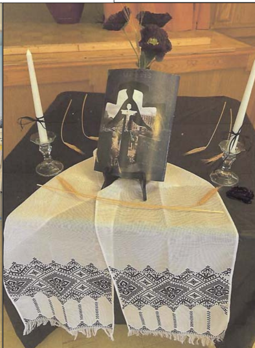
Столик «Пам'ять про жертв Голодомору-геноциду»