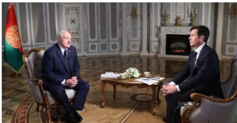
Під час інтерв'ю

https://www.belta.by/president/view/lukashenko-o-vagnerovtsah-nikto-ni-iz-ukrainy-ni-iz-rossii-mne-po-etomu-voprosu-ne-zvonil-462568-2021/