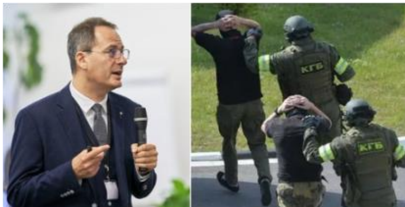
Христо Грозєв із Bellingcat і затримання «вагнерівцїв» в Мінську

«Казав пан – кожиха дам, та слово його тепле», на сучасний лад – «скільки ще чекати обіцяного від Грозєва».