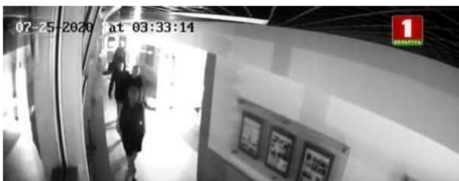
Заселення «вагнерівців» в готель (зверніть увагу на дату і час), зафіксовані відеокамерою

Центр (IBB Minsk) знаходиться на просп. Газети Правда, 11 – в 200 метрах від німецького посольства (просп. Газети Правда, 11-д).