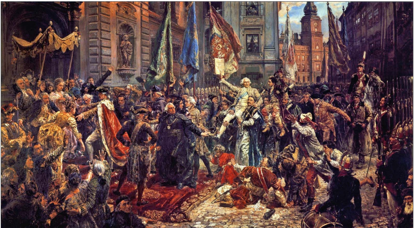
Ян Матейко. Картина «Конституція 3 травня 1791 року»

Конституція 3 травня 1791-го року була прийнята за чотири роки до цілковитого щезнення Речі Посполитої з мапи Європи. Але, щоб зрозуміти її моральну вагу й ідейну силу, треба заглянути на сто років назад і спробувати розтлумачити історію цієї держави протягом