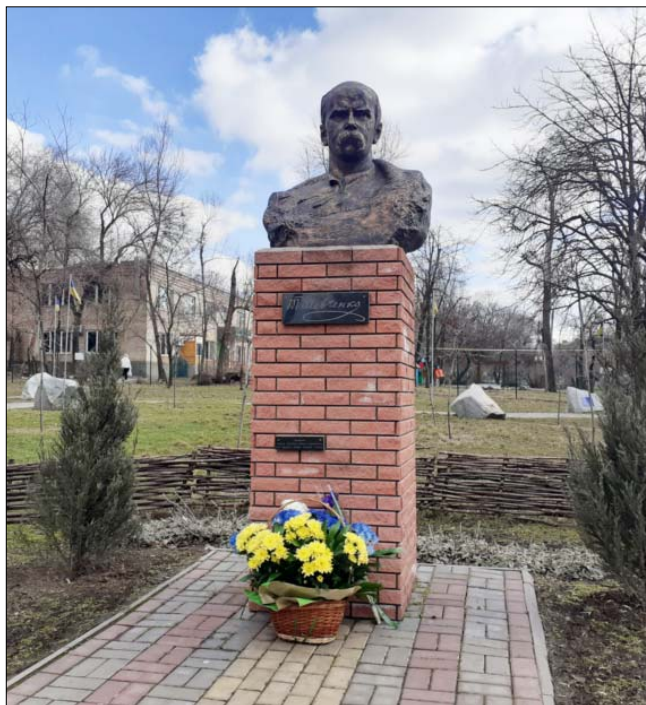
Пам'ятник Шевченку біля Театру Молоді (Запоріжжя)

Світлини Анатолія Ажажи і Віталія Міхаловського