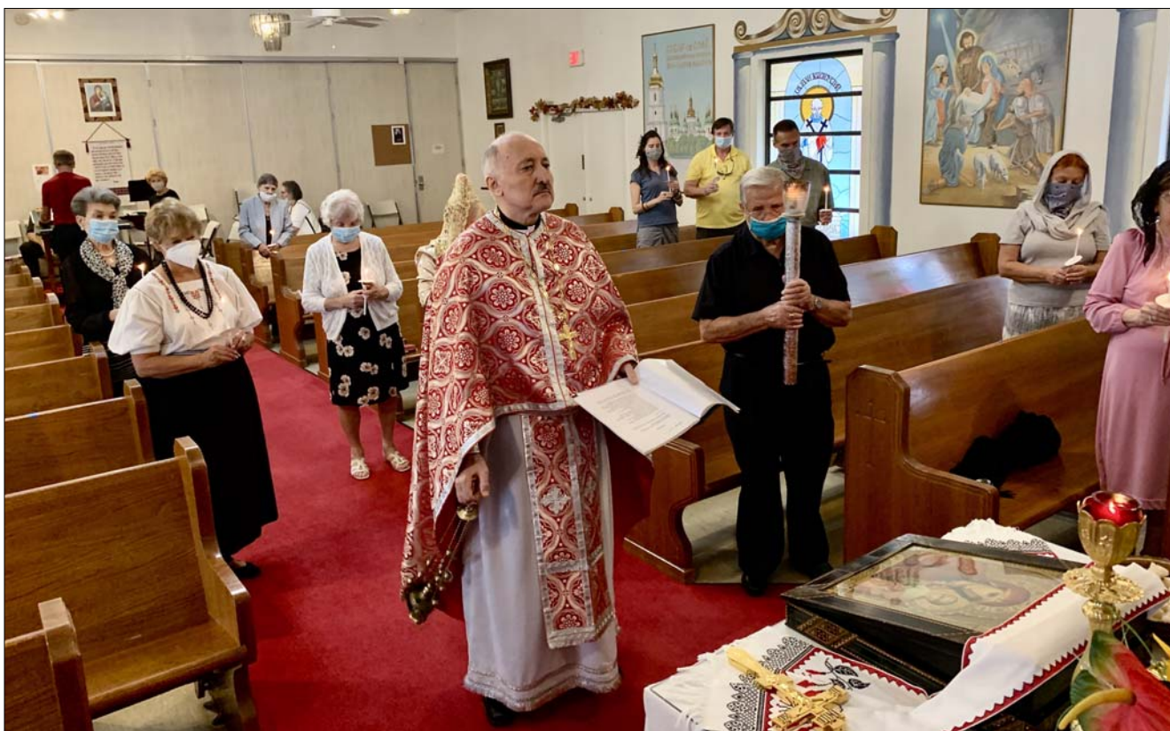
Панахида в церкві св. Андрія