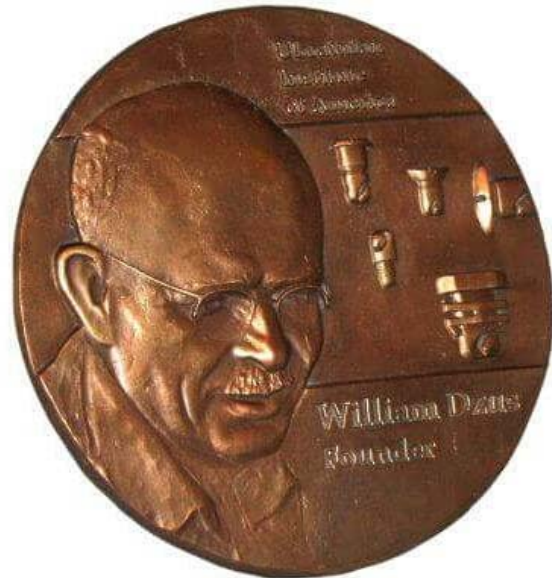
Пам'ятна монета «Вільям Джус – персона року»

28 жовтня 1953 року на перших загальних зборах делегати від 20 авторитетних українських родин обрали управу Інституту: