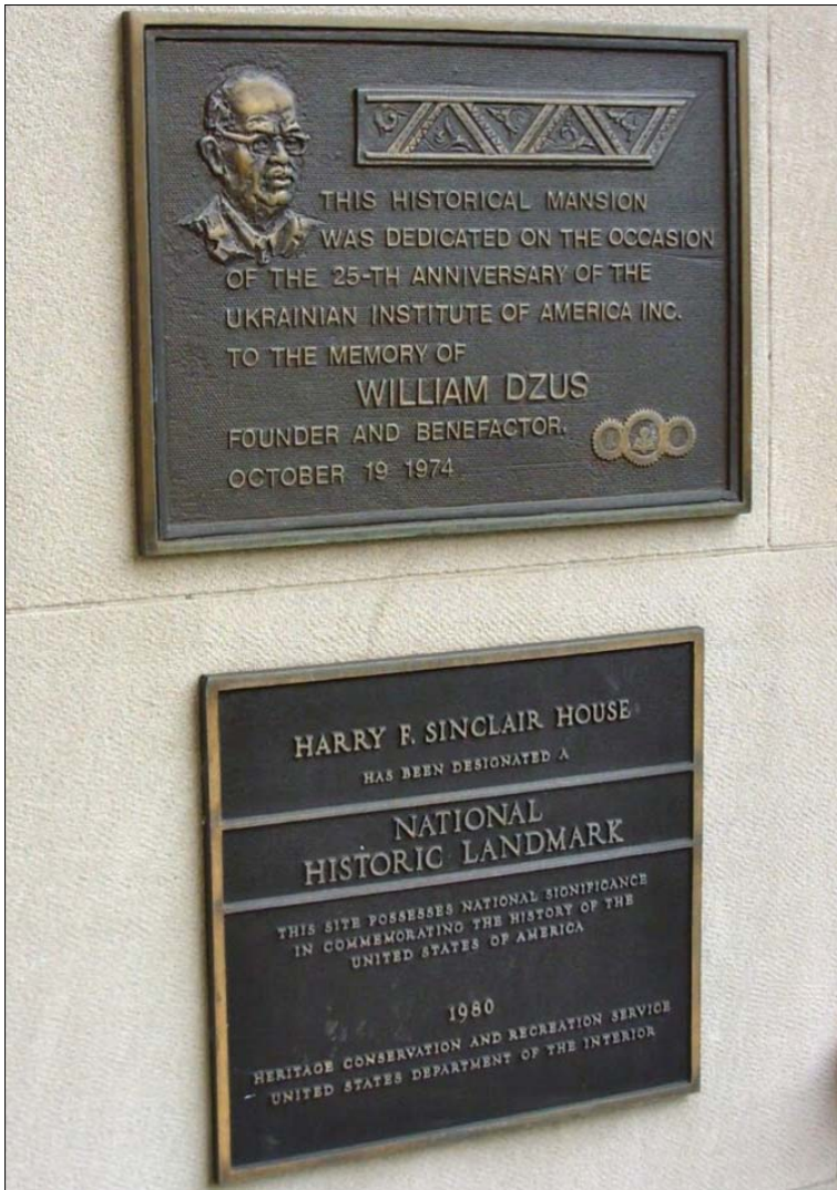
Пам'ятна табличка, присвячена Володимиру Джусу, на фасаді Українського Інституту Америки в Нью-Йорку