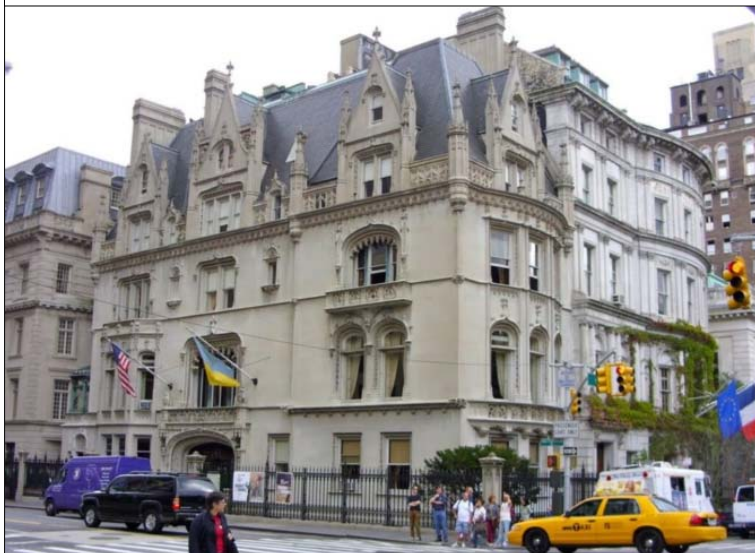
Український Інститут Америки в Нью-Йорку