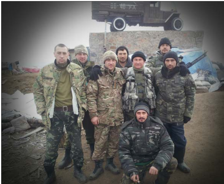
Хлопці з мого підрозділу, позиція «Полуторка»