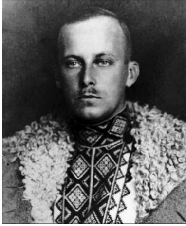
Вільгельм Габсбург (Василь Вишиваний) (1914–1915 рр.)

Приводом до цього стала домовленість німецького кайзера Вільгельма II та австрійського цісаря Франца-Йосифа I про відновлення Польської держави та її формальне проголошення. Після формального проголошення держави польські політичні лідери повели шалену агітацію проти ідеї Української держави, унаслідок чого почалася боротьба всіх польських сил і засобів за прилучення Східної Галичини до складу Польщі [8].